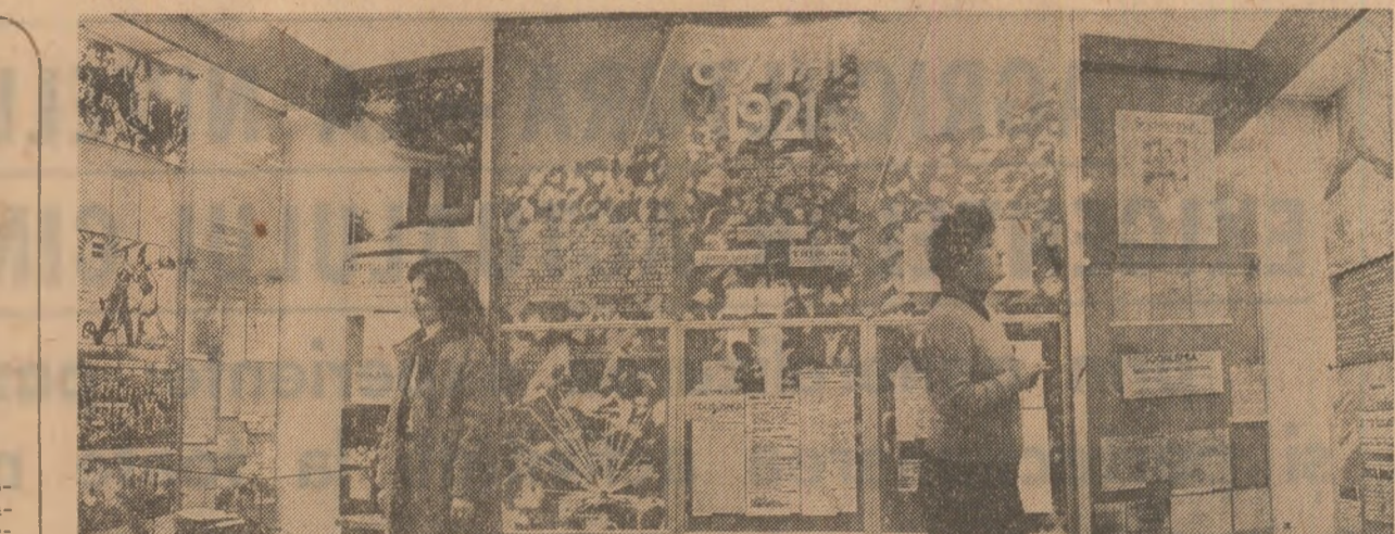
Interior la Muzeul de istorie din Timișoara.

laud de atita-nțelepciune / De-atita măiestra lucrare să te slăvesc: / Acest bărbat este izbînda ta și a tuturor piscurilor cele din preajmă — / Țaria și înțezimea noastră au izbîndit / Ai zămislit un bărbat cu demnitate înalțimilor / M-am dus în calea oamenilor și le-am spus: / Slăvesc pe voi, merrții de mult această izbînda, / V-ați ales un bărbat curajoș cum și-merită țara / Măsură și speranța noastră nu vor fi stîrbite, Ceaușescu este dreptul vostru, datoria noastră către lume... / Ceaușescu este ceea ce nu i se mai poate lua poporul / Ceaușescu este unde-a alții chezașul lumii suprem, / Cel mai bun din ai patriei lui / Totdeauna în juru-i vom fi” (Victor Tulbure: Cel mai