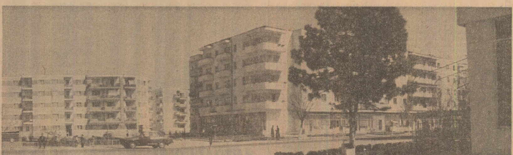
Țăndărești — odinioară una dintre comunele țării — este, tot mai mult, unul dintre reperele industriale de pe harta patriei. Orașul — a cărui producție industrială va ajunge în curînd la două miliarde de lei anual — produce tot atât zahăr cît România anilor '30. În fotografie: Citeva dintre cele 1 500 de apartamente construite în ultimii ani

de plan? Fără îndoială că nu. Și în unele dintre întreprinderile amintite, și în altele, în care metodele de utilizare a laminarelor nu a sporit în mod semnificativ, există importante rezerve de folosire mai bună a capacităților de producție care pot fi puse în valoare prin eforturi sustinute orientate spre organizarea superioară și modernizarea proceselor de fabricație, perfecționarea tehnologiei, întărirea disciplinei în muncă, exploatarea, întreținerea și repararea corespunzătoare a agregatelor și instalațiilor.