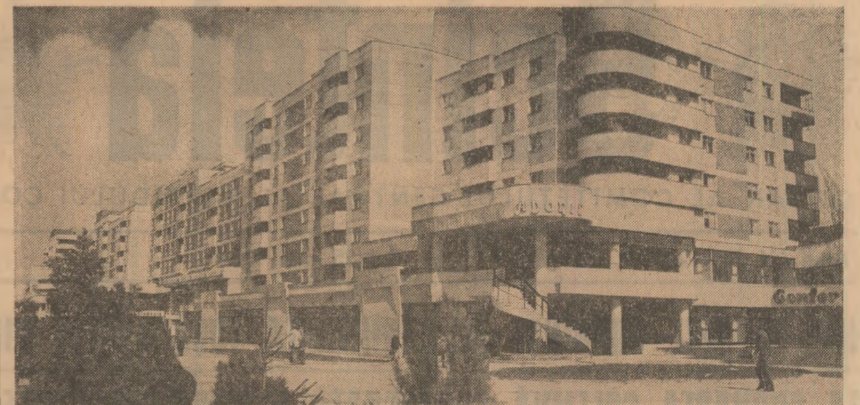
Din noua urbanistică a municipiului Alexandria: blocuri confortabile de locuințe, magazine spațioase.