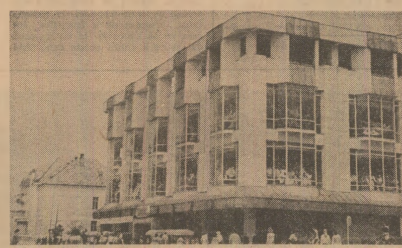
O nouă și modernă unitate comercială în municipiul Petroseni — magazinul universal.