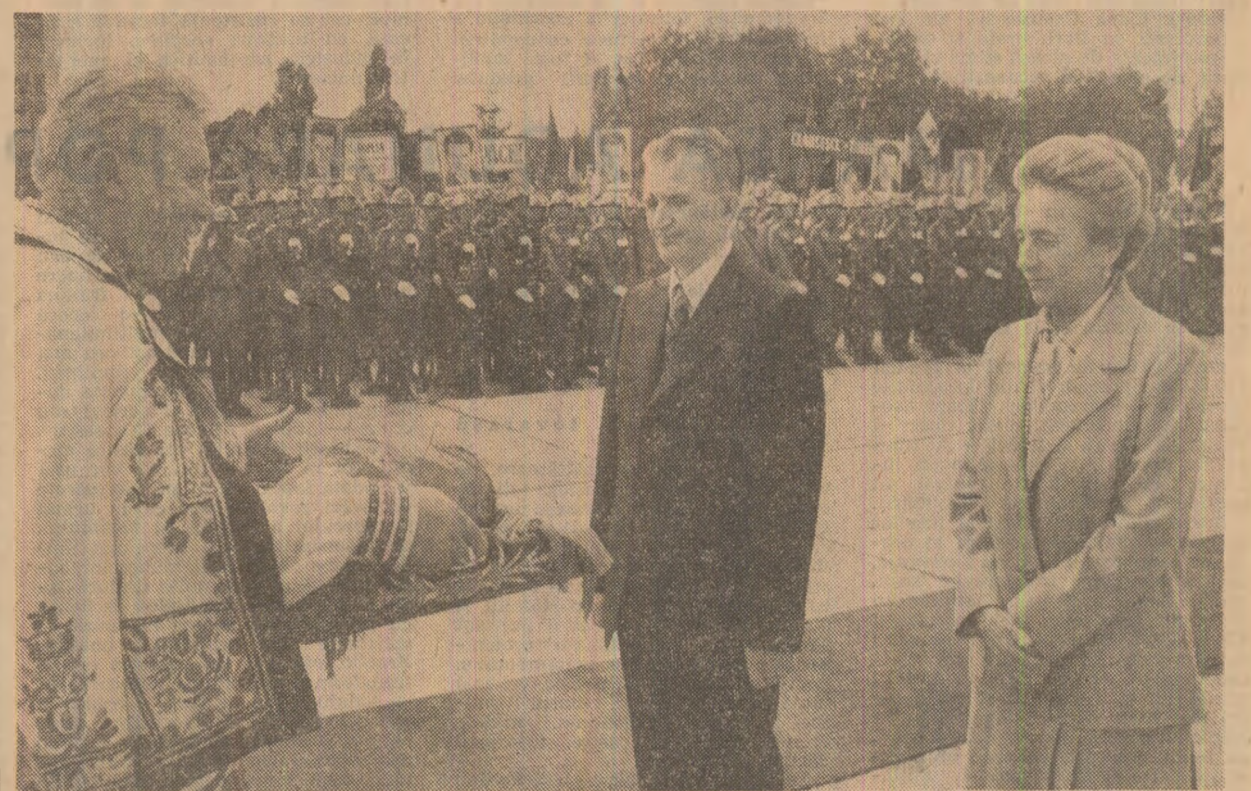
Ca pretendenți pe parcursul vizitelor de lucru efectuate în aceste zile, tovarășul Nicolae Ceaușescu, tovarăsa Elena Ceaușescu au fost înconjurați, la plecarea de pe aeroportul din Cluj-Napoca, de mii de oameni, cu însuflețite manifestări de stimă, dragoste și recunoștință