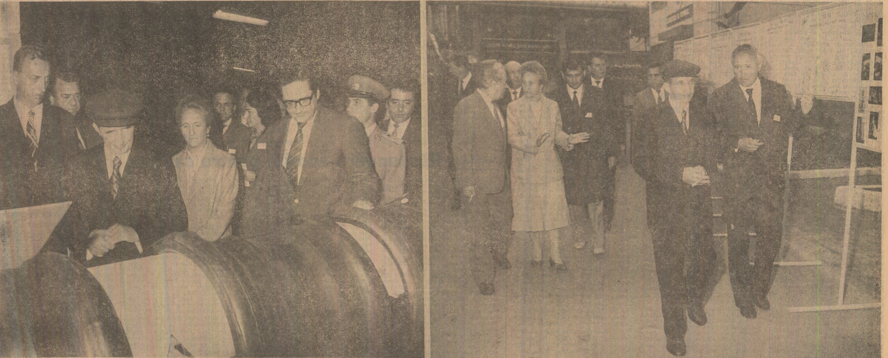
Momente ale rodnicului dialog de lucru cu oamenii muncii de la Întreprinderea de anvelope și Întreprinderea de armături industriale din fontă și oțel

Dragi tovarăși, Doresc, încă o dată, să exprim deplina noastră satisfacție pentru constatarea pe care le-am făcut cu privire la rezultatele activității oamenilor muncii din Sălaj, la entuziasmul și hotărîrea cu care se acționează în vederea înlăturării planului pe acest an, a hotărîrilor Congresului al XIII-lea al partidului. (Aplauze și urale puternice; se scandează îndelung „Ceaușescu — P.C.R.!” „Ceaușescu și poporul!”). Exprim, îndeosebi, deplina noastră satisfacție pentru noua întîlnire cu muncitorii, cu țărani, cu intelectuali, cu bărbaiți și femei, cu tineretul, cu copiii din