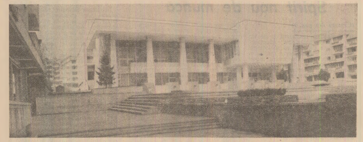
Casa de cultură a sindicatelor din municipiul Sf. Gheorghe