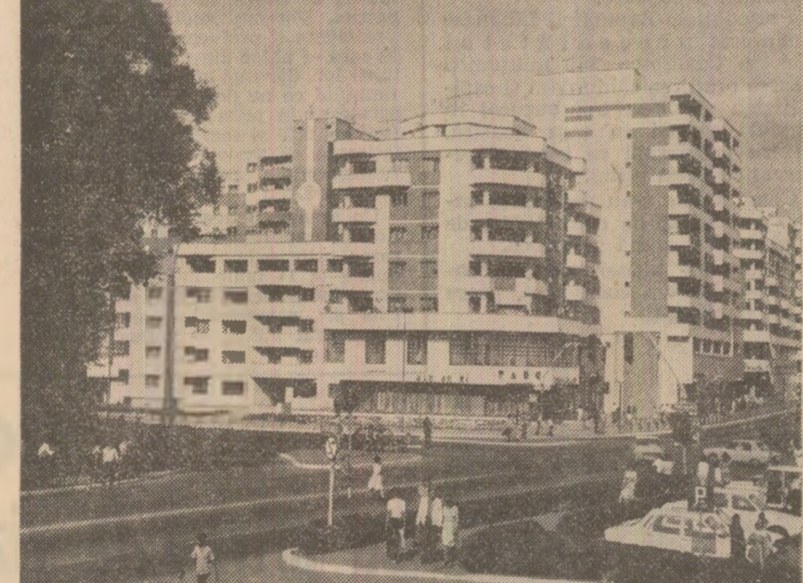
Arhitectură nouă la Tirgu Jiu

De neîntese de ce apelurile colectivului de la casa nr. 47, de a se face un gard a-