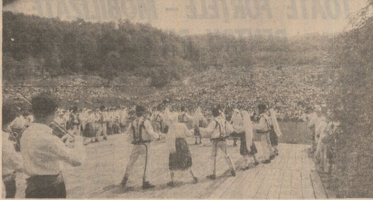
Amfiteatrul natural de la Gura Teghii, unde s-a desfășurat ediția a XVII-a a serbării folclorice „Pe urme de baladă” 1 iunie '86