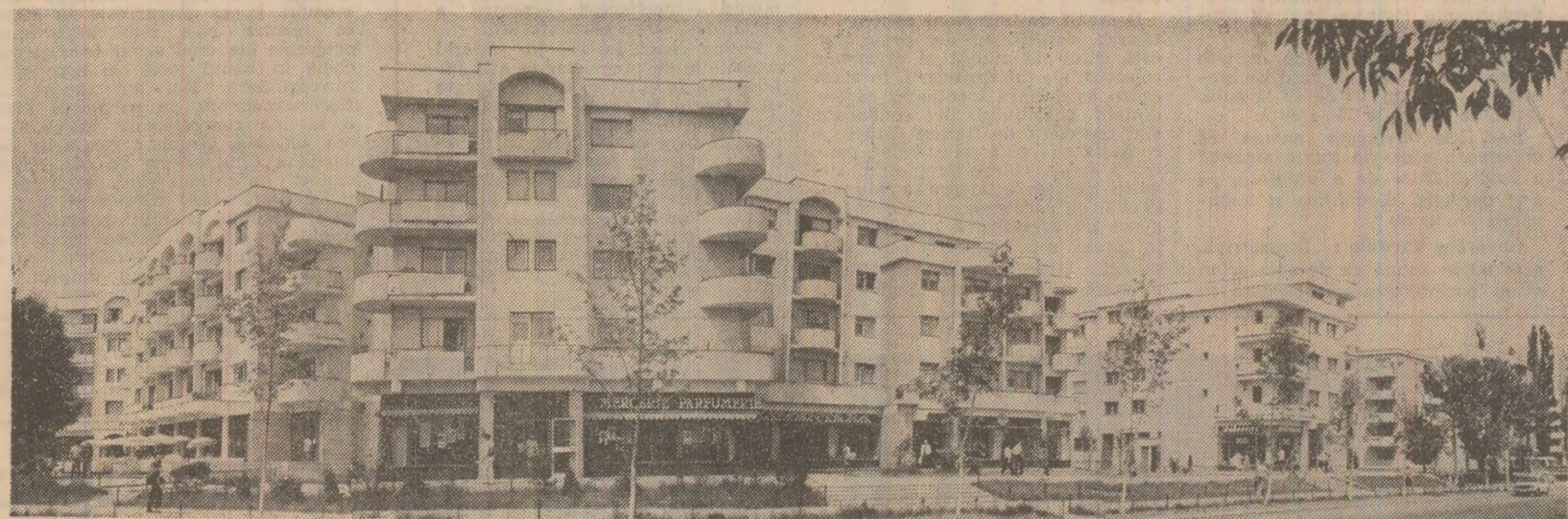
Din noile ansambluri de locuințe ale Bucureștiului: cartierul Aviației

PUBLICĂM ÎN PAGINA A III-A CORESPONDENȚE DIN JUDEȚELE OLT, CALĂRAȘI ȘI VILCEA PRIVIND MERSUL LUCRĂRILOR AGRICOLE DE VARĂ