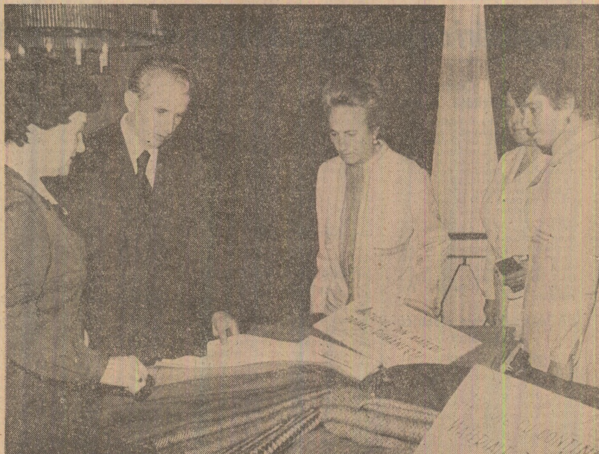
La Intreprinderea de stofe din Brașov