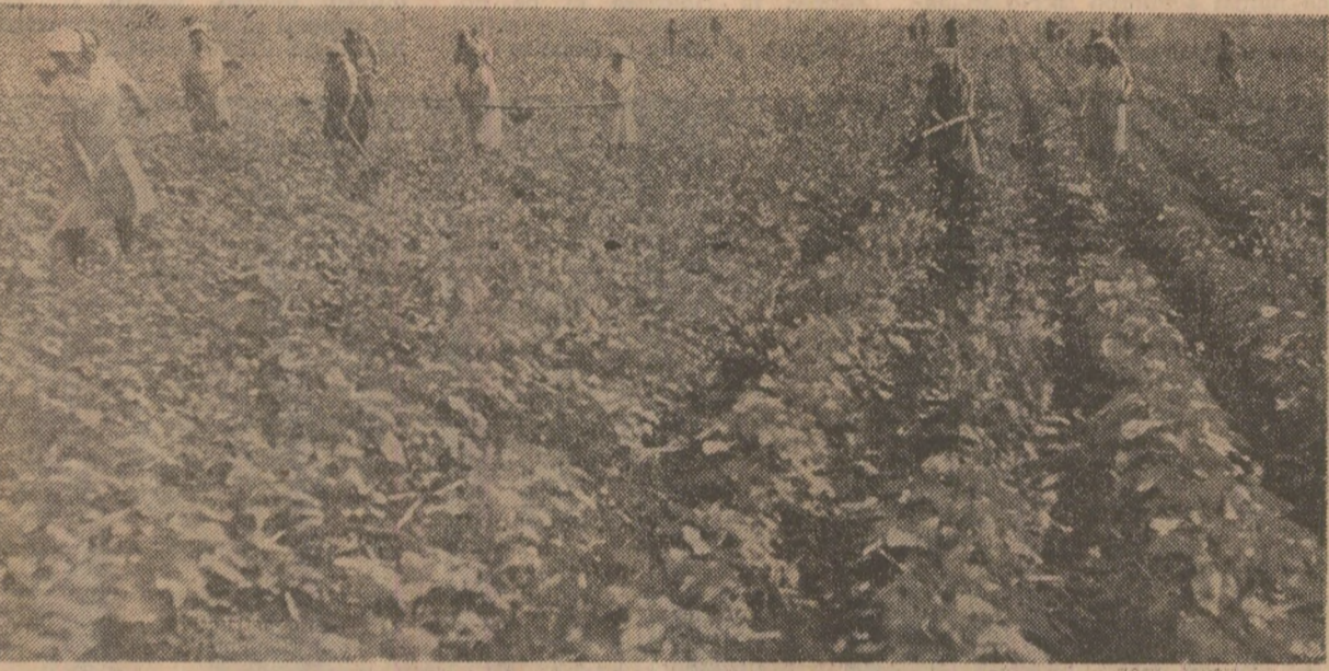
După ploile din ultimele zile, culturile prășitoare se dezvoltă viguros. Pentru obținerea de recolte mari, hotărîtoare sînt acum lucrările de întreținere. La executarea acestora, în județul Ialomița, participă un mare număr de oameni.