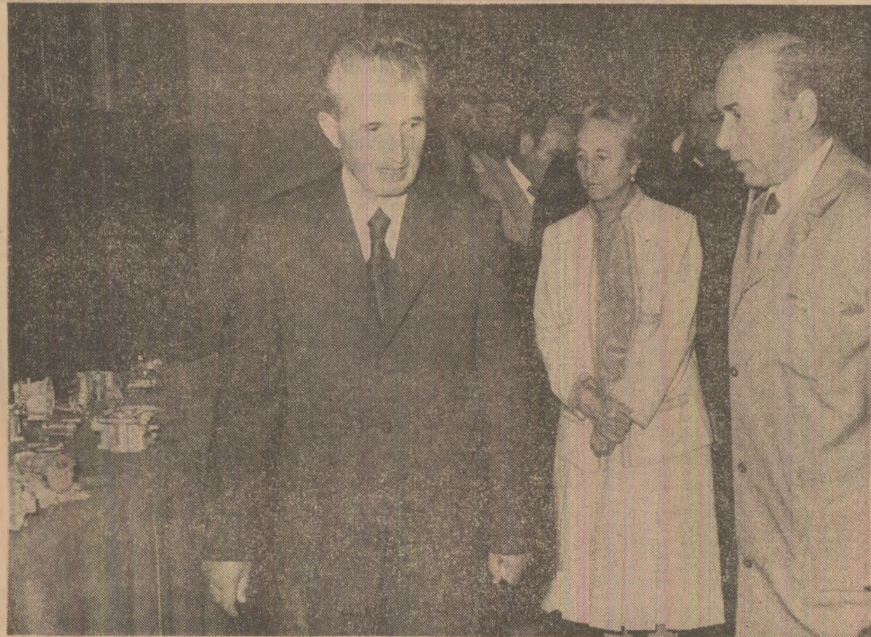
La Intreprinderea nr. 2 — Brașov