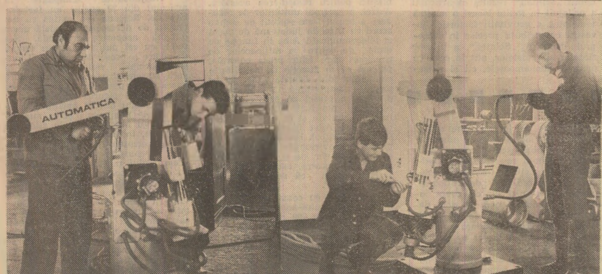
La întreprinderea „Automatica” din București se realizează o serie de echipamente care vor permite viitorilor roboți să satisfacă exigențele modernizării producției.

EXEMPLUL FRUNTAȘILOR TREBUIE NEÎNTRIZAT URMAT. Fără îndoială, în multe întreprinderi din cadrul centralei de resort s-a acumulat o bună experiență în ce privește îndeplinirea planului la producția fizică. O demonstrează cu prisosință utilajele și instalațiile de înaltă complexitate tehnică livrate combinatelor petrochimice din Borzești, Mîdia-Năvodari, Telegaș ș.a., multe dintre ele realizate pentru prima dată în țara noastră. Astfel, colectivul de la întreprinderea de utilaj chimic „Grivita roșie” din Capitală și-a îndeplinit planul la toți indicatorii, livrînd suplimentar beneficiarilor interni și partenerilor străini utilaje în valoare de peste