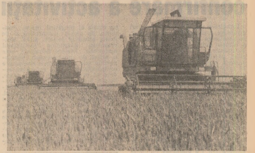
Imagini obișnuite din aceste zile de campanie.

Am urmărit cum se desfășoară aceste lucrări în mai multe unități agricole din consiliul agroindustrial Săscuț, consiliu care are în cultură 4.300 hectare cu grîu. Măsura luată privind utilizarea combinelor dă bune rezultate la cooperativa agricolă din Săscuț. Tovarășul Nicolae Păvăloiu, inginerul-șef al unității, ne-a informat că toate cele 15 combinate au fost reparatizate pe ferme și se urmărește ca ele să lucreze la întreaga capacitate folosindu-se fiecare oră bună de lucru în răstimpul dintre ploa. Ca urmare, în 3 zile s-a strîns cîteva sute de tone de grîu, din cele 1.230 hectare cultivate în cooperativă. Lucrîndu-se în flux continuu, întreaga recoltă este transportată în magazii în aceeași zi. Pe cîmp, oamenii mulți adună spicetele și palele, iar tractoarele balotî și cîlele în baza furajeră, mecanizatorii ar și însămînțează. Alături, pe tarabele întinse pentru aerisirea grîului, se desfășoară lucrările de curățare și condiționare a produsului finit.