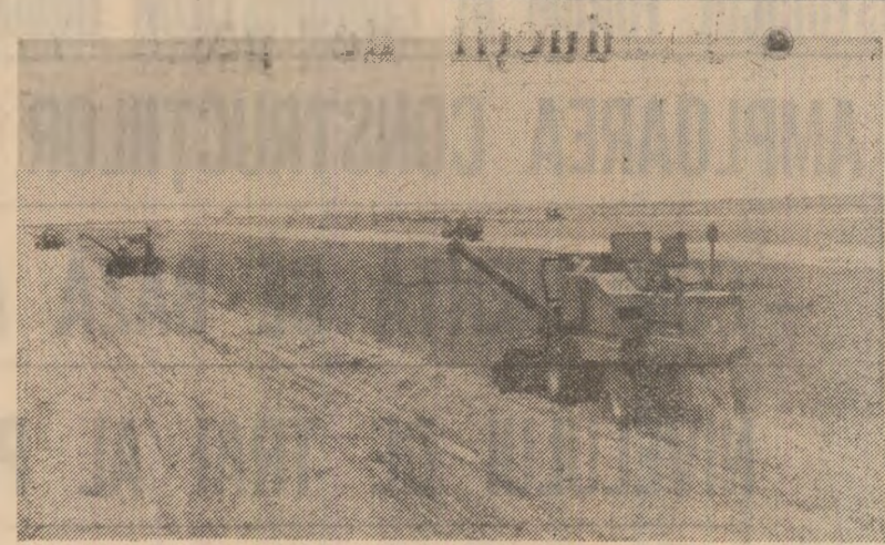
Recoltarea gruiului, în Insula Mare a Brăilei