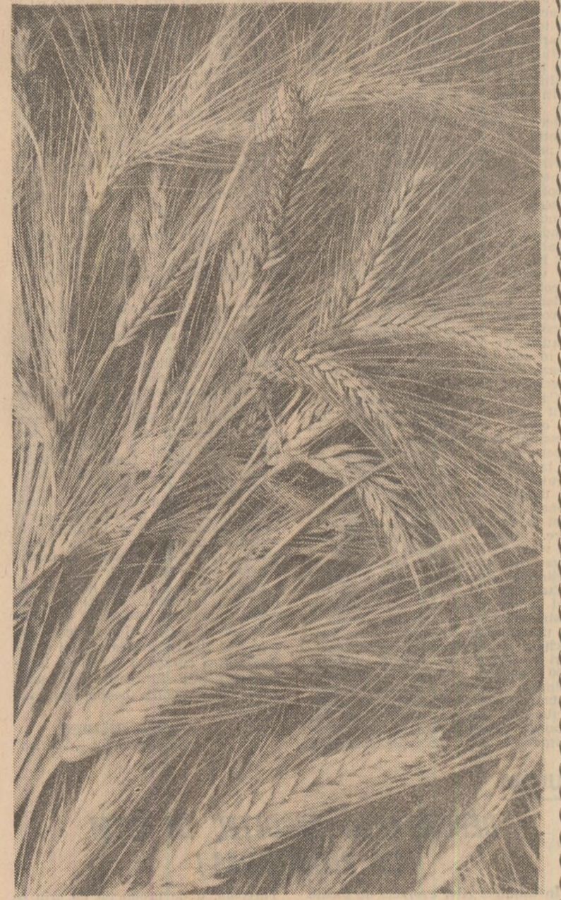
Spice din care la C.A.P. Scornicești a rodit, în medie, peste opt tone de grâu la hectar

Cîteva învățăminte și concluzii practice ce se desprind pentru organizațiile de partid, pentru organele și unitățile agricole, îndeosebi din județele în care ponderea solurilor podzolice, în general a solurilor sărace, este mare.