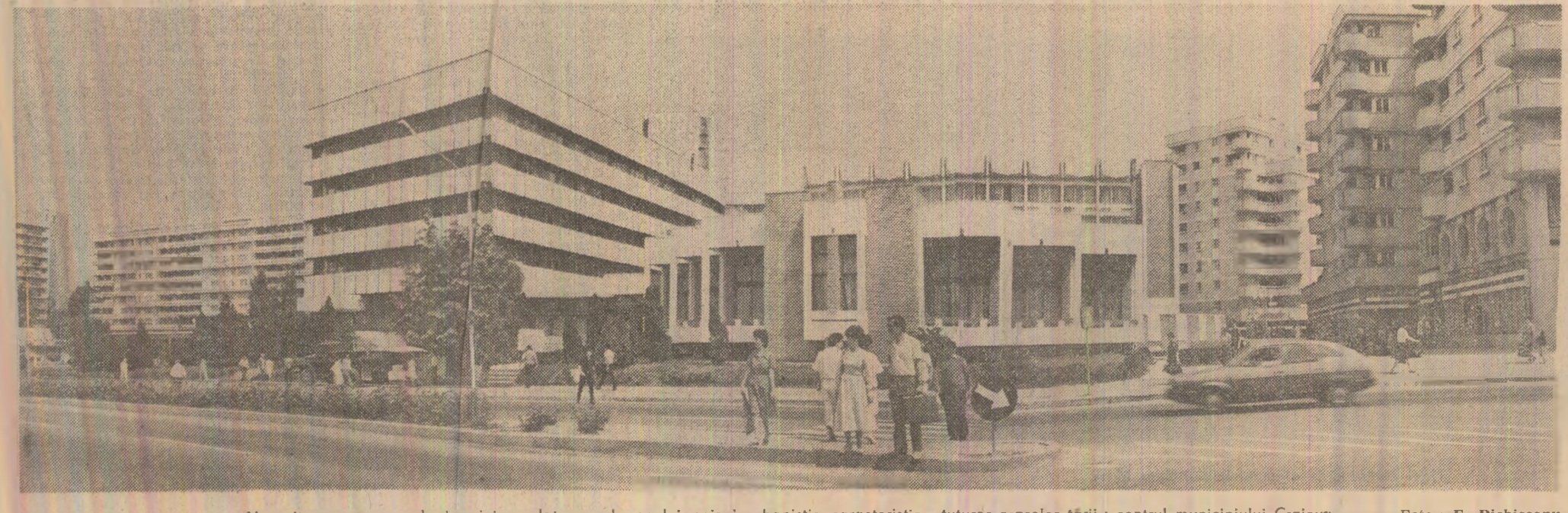
Una dintre numeroasele inagini revelatoare ale noului peisaj urbanistic caracteristic tuturor orașelor țării: centrul municipiului Craiova.

Traducînd cu hotărîre în viața indicațiile și orientările secretarului general al partidului, date cu prilejul vizitei de lucru efectuate recent în județul Giurgiu, colectivile de oameni ai muncii de aici au intrat în cel de-al doilea semestru al anului cu o depășire a sarcinilor de plan la producția marfă industrială în valoare de 60 milioane lei. De la începutul anului și pînă în prezent s-au produs și livrat suplimentar economiei naționale 1 980 000 mc gaze asociate utilizabile, 1 643 tone utilaje tehnologice miniere, 300 tone utilaje pentru industria metalurgică și altele. De asemenea, au fost livrate la export, în avans, 2 barje de 1740 tone fiecare. Aceste succese se datorează în principal preocupărilor constante pentru creșterea mai accentuată a productivității muncii, indicator care în acest an este mai mare cu 3 la sută față de plan. (Ion Manea, corespondentul „Științei“).