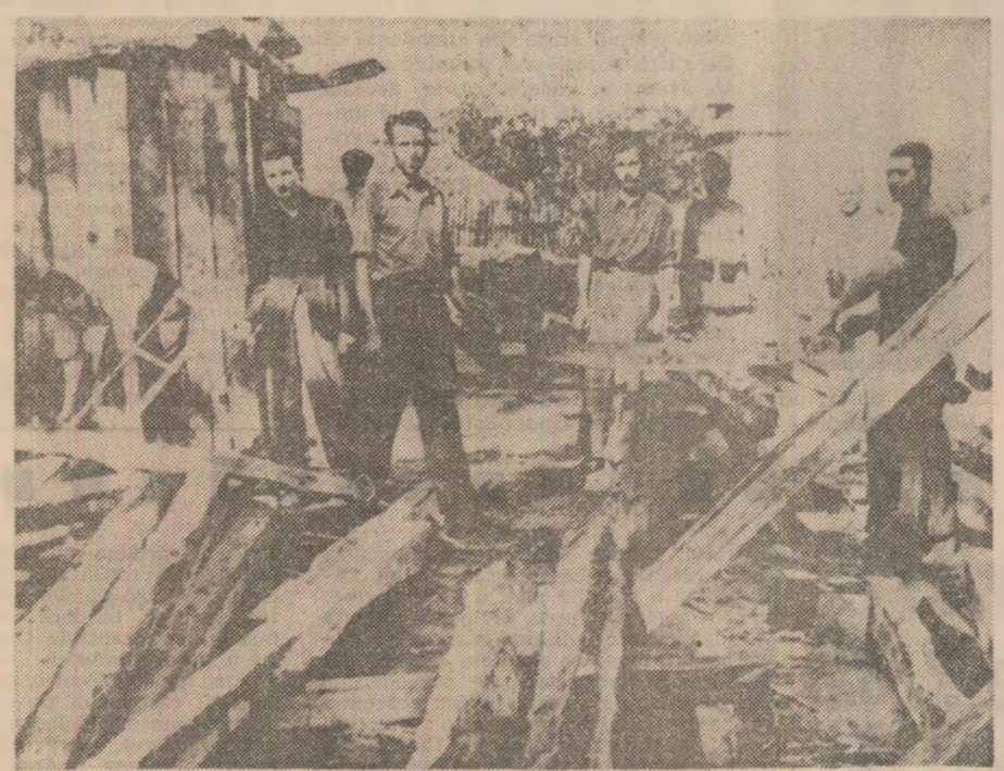
Tovarășul Nicolae Ceaușescu, alți militanți comunisti, în lagărul de la Tg. Jiu

regimului politic în închisori. Din inițiativa partidului au fost create numeroase organizații legale destinate apărării și ajutorării deținuților politici, au fost editate manifeste, broșuri, foi volante, au fost publicate în presă informații privitoare la stările de lucruri din temnițe, în primul rînd de la Doftana. Partidul a imprimat luptei pentru apărarea deținuților politici un caracter de front unic muncitoresc, acesta făurindu-se practic în numeroase intruniri, adunări de protest, demonstrații, la care au participat muncitori comunisti, social-democrați, intelectuali progresisti, etc. La chemarea partidului au avut loc în întreaga țară impunătoare manifestări, în care s-a cerut stingerea proceselor antifasciste, regim politic în închisori, eliberarea deținuților politici comunisti și antifascisti. La 31 mai 1938, spre exemplu, la București a demonstrat peste o sută de mii de oameni în întreaga țară circa jumătate de milion. Asemenia cifre vorbesc graitor despre faptul că muncile erau adinc conșinse că ferurile luptei pentru care fusese arătați, judecați, condamnați și întemnițați militanții comunisti și antifascisti își aveau izvorul în vîrrele și nădejdele de mai bine ale celor mulți și asupriți, în nevoile țării, în imperiile momentului. Temnițe-