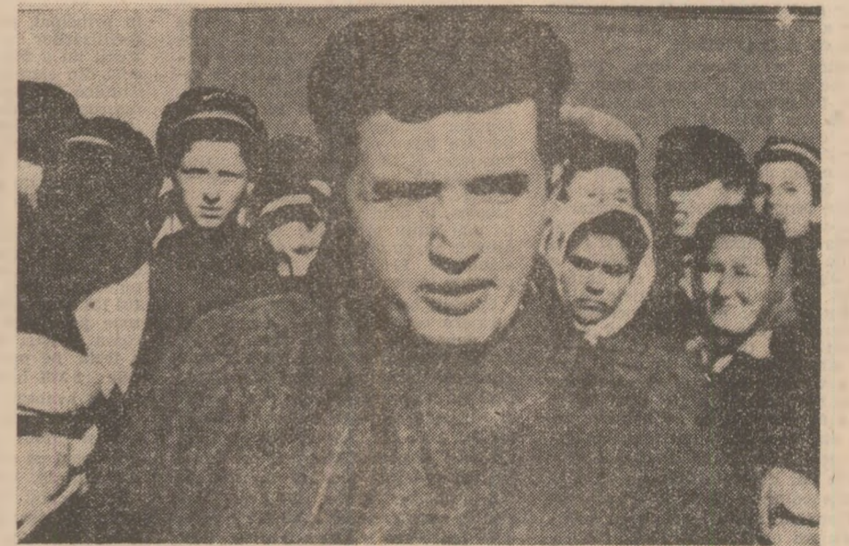
Tovarășul Nicolae Ceaușescu vorbind la un miting al tineretului, 1946

Eforturile depuse de partidul nostru comunist pentru asigurarea unei puternice organizări a deținuților politici de la Doftana, incit aceștia să poată răspunde prompt și hotărît terorii, au fost conjugate cu inițierea unor ample acțiuni în afara închisorilor, spre a dezvălui adevărul despre regimul de detenție din temnițe, spre a antrena opinia publică din țară, opinia publică progresistă internațională în lupta pentru amnistierea deținuților politici, pentru impunerea și respectarea