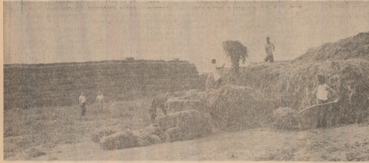
Cooperatorii din comuna Herești, județul Giurgiu, depozitează mari cantități de finuri pentru perioada de iarnă