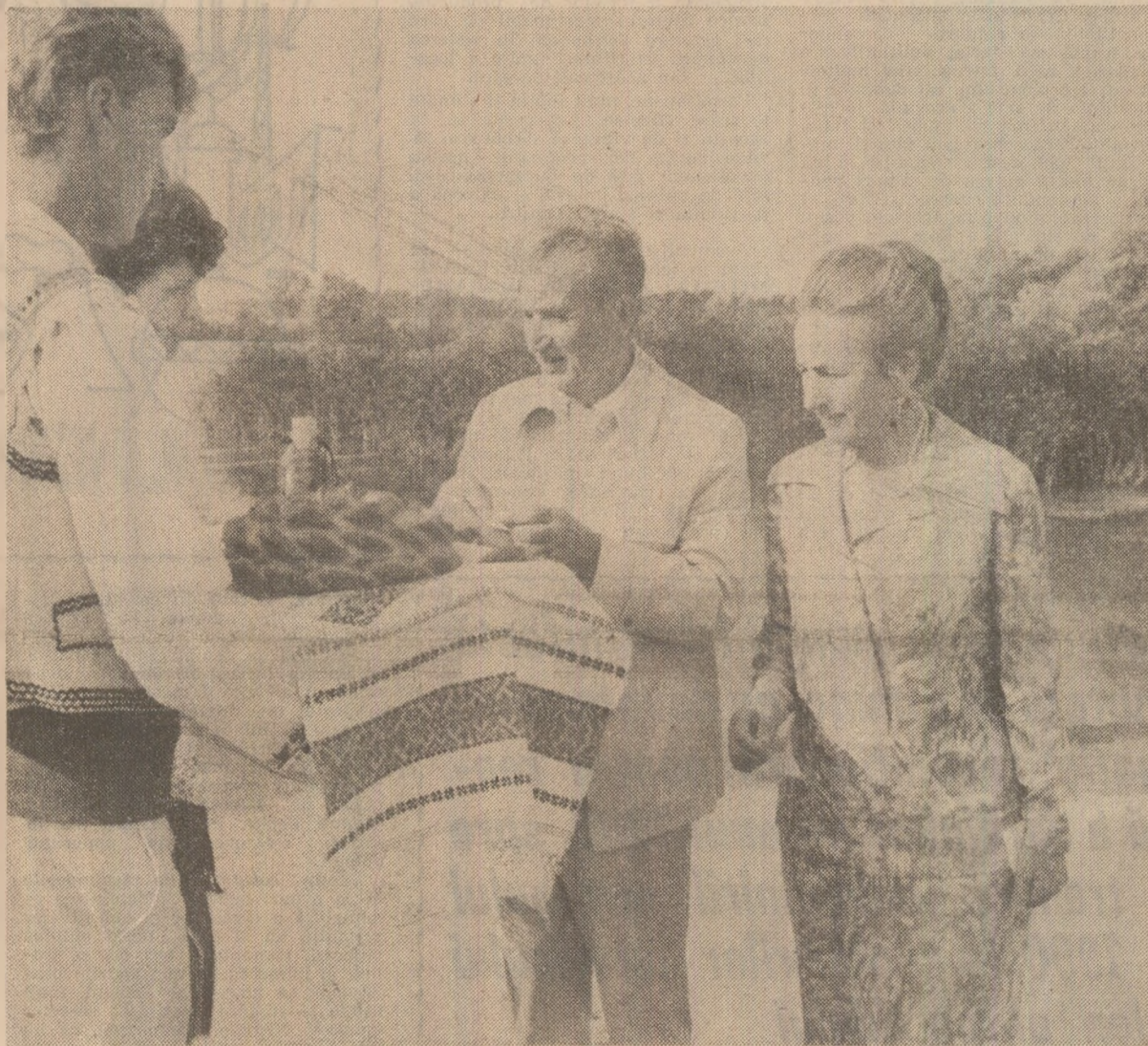
Locuitorii comunei Sfântu Gheorghe întâmpină pe tovarășul Nicolae Ceaușescu și pe tovarășa Elena Ceaușescu cu toată căldura inimilor, după datina străbună

Acțiunile întreprinse până în prezent în vederea transpunerii în viață a măsurilor stabilite s-au concretizat într-o serie de rezultate semnificative. Astfel, suprafața arabă cultivată în Delta a ajuns în acest an la 32.500 hectare, cu 2.580 hectare mai mare decât în 1985 și s-au prelevat prevederilor din program. De pe aceste pământuri înfructe în circuitul agricol s-a realizat o însemnată cantitate de cereale, plante tehnice, legume, fructe. Totodată, au fost depășite prevederile stabilite privind dezvoltarea zootehniei, precum și producțiile animale stabilite, ceea ce a creat posibilitatea