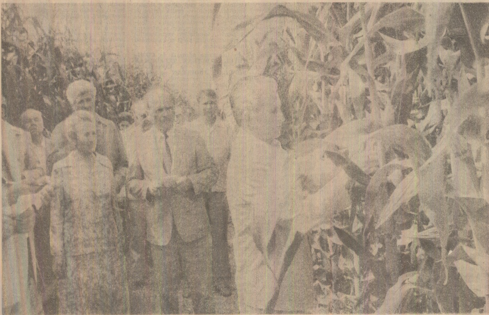
În lanurile de porumb ale centrului de producție „Antipa”