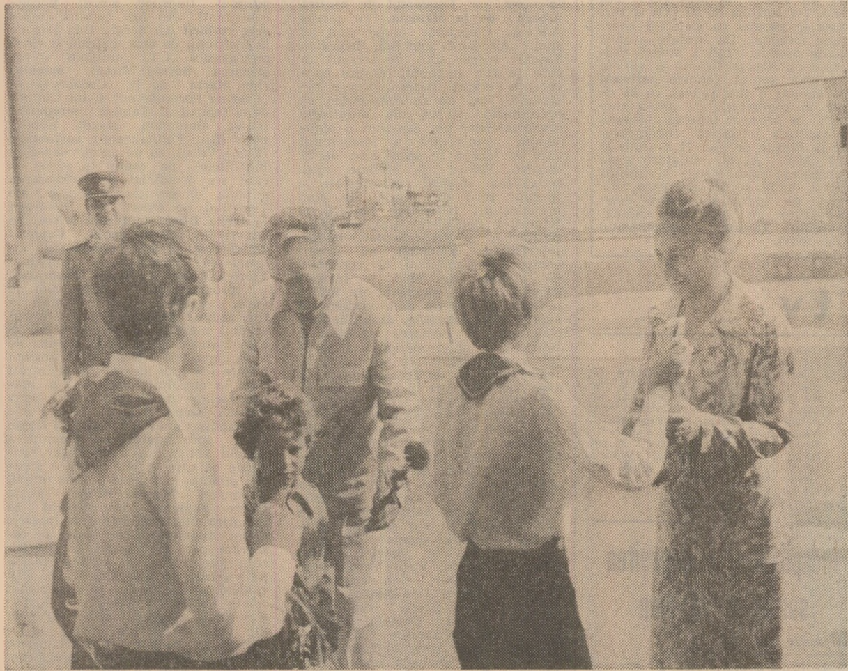
La Sulina — florile dragostei, florile recunoștinței