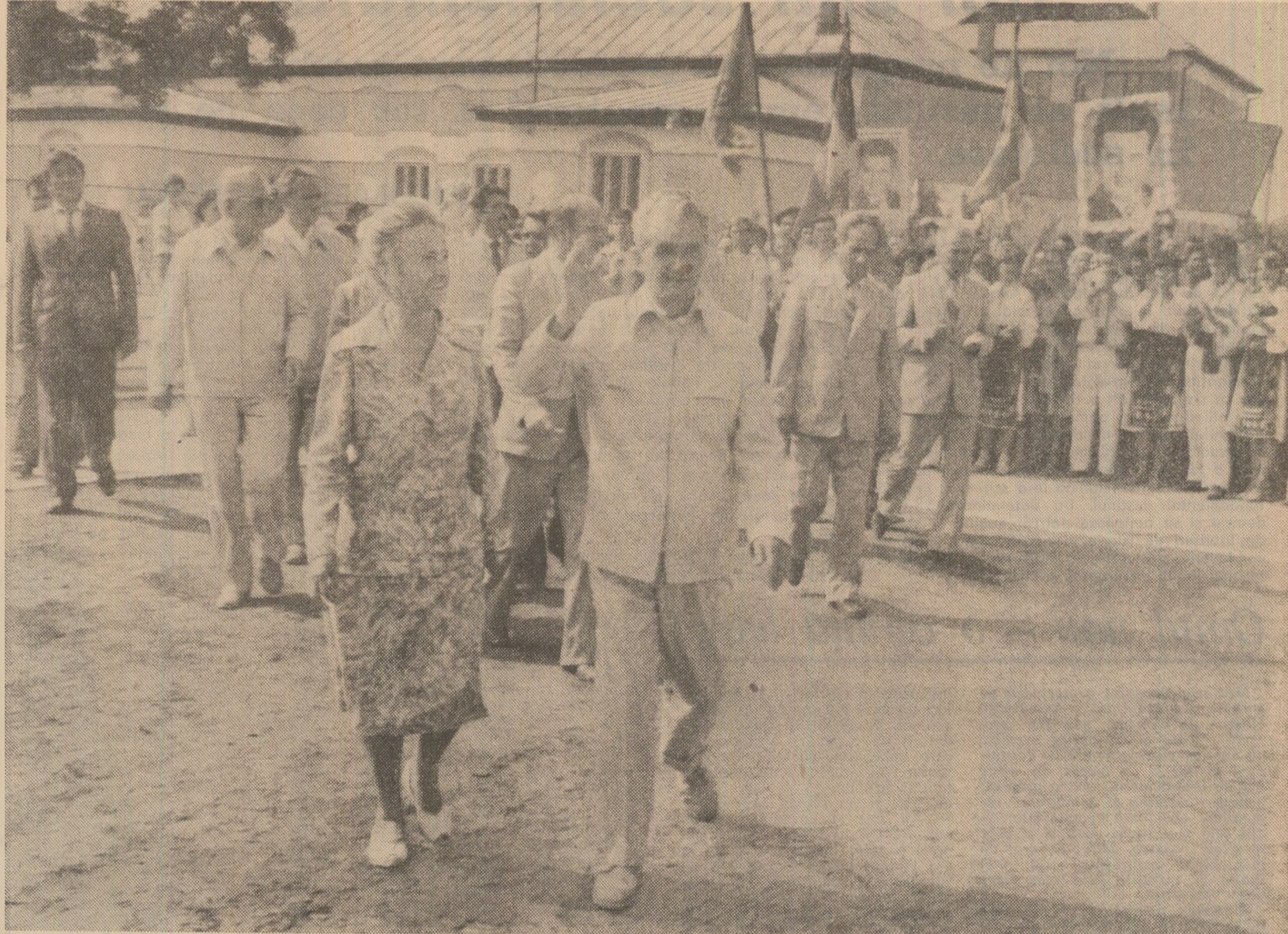
Moment din timpul vizitei la Chilia Veche

În cinstea soțiilor secretarului general al partidului, președintelui Republicii, tovarășul Nicolae Ceaușescu,