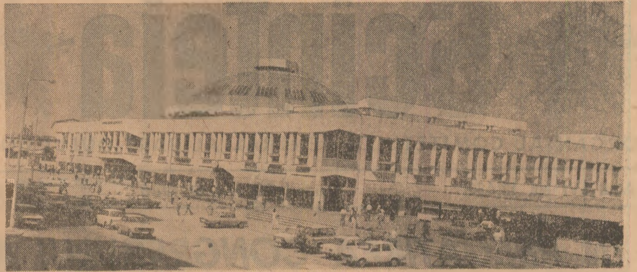
Complexul agroalimentar din Piața Delinului, sectorul 2 al Capitalei.

să legătură cu măsurile luate în vederea instruirii și pregătirii acestuia. Astfel, cunoașterea unor hotărâri și măsuri adoptate de organele superioare de partid și de stat, de comitetul municipal nu se realizează numai prin prezentă - a fie în totalitate, fie pe domenii - la planificare și prin participarea sistematică a membrilor activului la instruirea lunară sau trimestrială ale aparatului de partid, activiștilor-instructori, ale secretarilor și membrilor comitetelor de partid și ai birourilor organizațiilor de bază. Cu aceste prilejuri se stabilesc sarcini concrete pentru membrii activului și, totodată, se jalonează munca acestora pe o perioadă mai îndelungată de timp. De asemenea, acordăm o atenție deosebită largii permanențe a orizontului de cunoștințe politico-ideologice și profesionale, urmărind riguros participarea tuturor membrilor activului comitetului municipal de partid la învățămîntul politico-ideologic, la universitatea politică și de conducere, în calitate de cursanți sau propagandiști. Mulți dintre ei își aduc o contribuție permanentă la desfășurarea unor dezbateri și expuneri în cadrul colectivelor de oameni ai muncii. Din analiza exigentă a rezultatelor de până acum se desprinde că în activitatea noastră sînt deosebit de actuale cerințele subliniate de tovarășii Nicolae Ceaușescu la Plenara C.C. al P.C.R. din iunie a.c. privind necesitatea perfecționării muncii activului, a participării acestuia în pri-