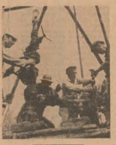
Pe ce se întemeiază acest spor de producție?

utilajelor si instalatiilor. In spiritul sarcinilor subliniate de secretarul general al partidului la recenta sedinta a Comitetului Politic Executiv al C.C. al P.C.R., petrolistii au datoria sa ia masuri urgente, hotarite pentru realizarea sarcinilor de plan, pentru recuperarea restantelor profunditei aceluia este, pentru a da farii ei mai mult tije si gaze naturale. Rezultatele obtinute in ultimul timp de unele unitati demonstreaza ca prin mai buna organizare a productiei si a muncii, prin folosirea intensiva a instalatiilor din dotare exista posibilitati reale de sporire a ritmului de extractie. La dozi asemenea exemple ne referim si in sondajul de azi al „Scintei”.