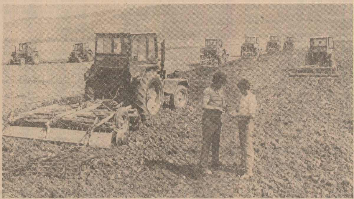
Arătura de calitate — principala condiție pentru însămîntarea în bune condiții a culturilor de toamnă