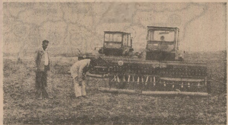
Sîmînțul grîului la C.A.P. Vinjulet, județul Mehedinți