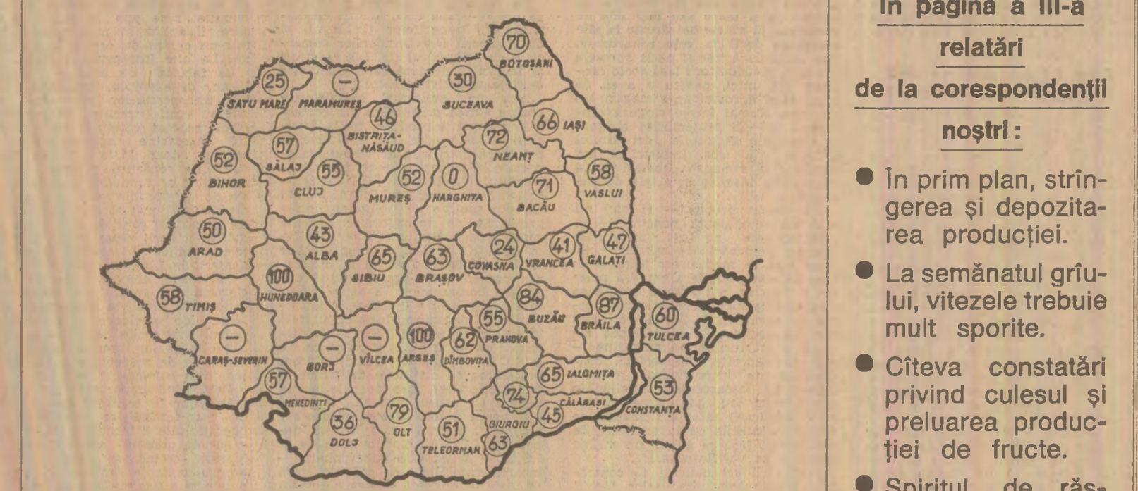
STADIUL RECOLTĂRII SPECIEI DE ZAHĂR. În procente, pe județe, în seara zilei de 7 octombrie. (Județele însemnate cu o liniuță nu cultivă speciile de zahăr)

În pagina a III-a relatări de la corespondenții noștri: