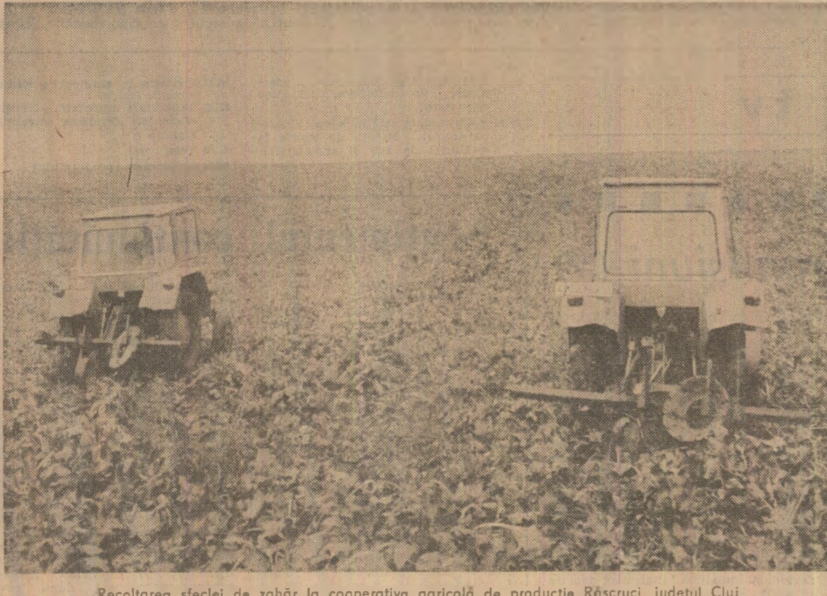
Recoltarea sfeclei de zahăr la cooperativa agricolă de producție Răscruți, județul Cluj

Citeva constatări privind culesul și preluarea producției de fructe în județul Dimbovița