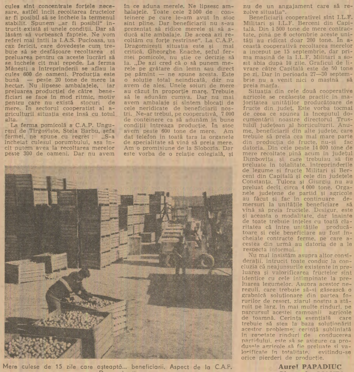
Mere culese de 15 zile care așteaptă... beneficiarii. Aspect de la C.A.P. Dragomirești

Grăbiți transportul sfeclei din cîmp! Datorită bunei organizări a transportului, alt încercări rapide a producției la cîmp, cît și folosirii din plin a atelejelor, în cooperativele agricole Vatra, Lunca, Verșeni, Miroslavesti, Popești, Podu Iloaiei, Clorjești, Schitu Duci și altele din județul Iași, graficele de livrare a sfeclei de zahăr către fabrica din Pașcani au început să fie depășite. Dimpoviriță, cooperativele agricole Bivolari, Strunga, Voinesii, Proboata, Dobrovăț, Gîrbiști și altele livrează în unele zile mai puțin de 10 la sută din cantitățile programate. Aceasta pentru că mijloacele de transport nu sînt folosite corespunzător, iar la încărcat și descărcat nu sînt destule echipe de cooperatori. Intensificarea transportului sfeclei de zahăr se impune și în unele unități agricole din consiliile agroindustriale. Valca