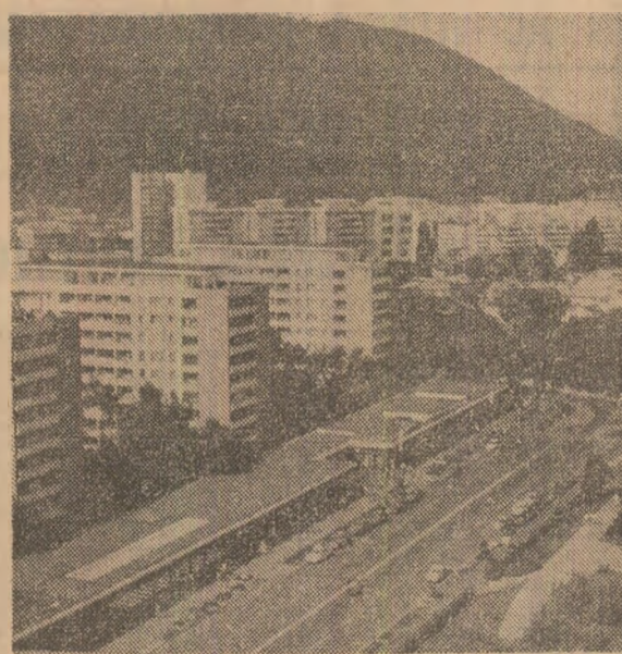
Vedere din zona centrului a municipiului Piatra Neamț