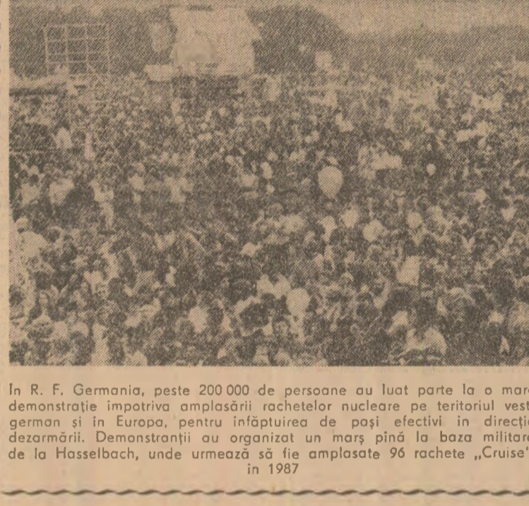
In R.F. Germania, peste 200.000 de persoane au luat parte la o mare demonstrație impotriva amplasării rachetelor nucleare pe teritoriul vestgerman și în Europa, pentru înlăturarea de poșii efectivi în direcția dezarmării.