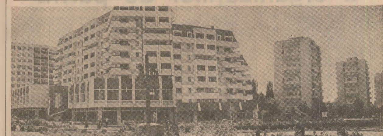
Pașcani: construcții moderne, demna de epoca pe care o trăim

Ambasadorul Regatului Unit al Marii Britanii și Irlandei de Nord a adresat calde mulțumiri președintelui Nicolae Ceaușescu, Consiliului de Stat și guvernului român pentru sprijinul ce l-a fost acordat în în-deplinirea misiunii sale în România.