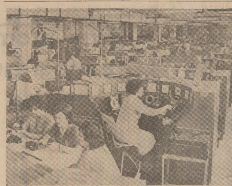
În secția reles termice a întreprinderii de contactoare din Buzău