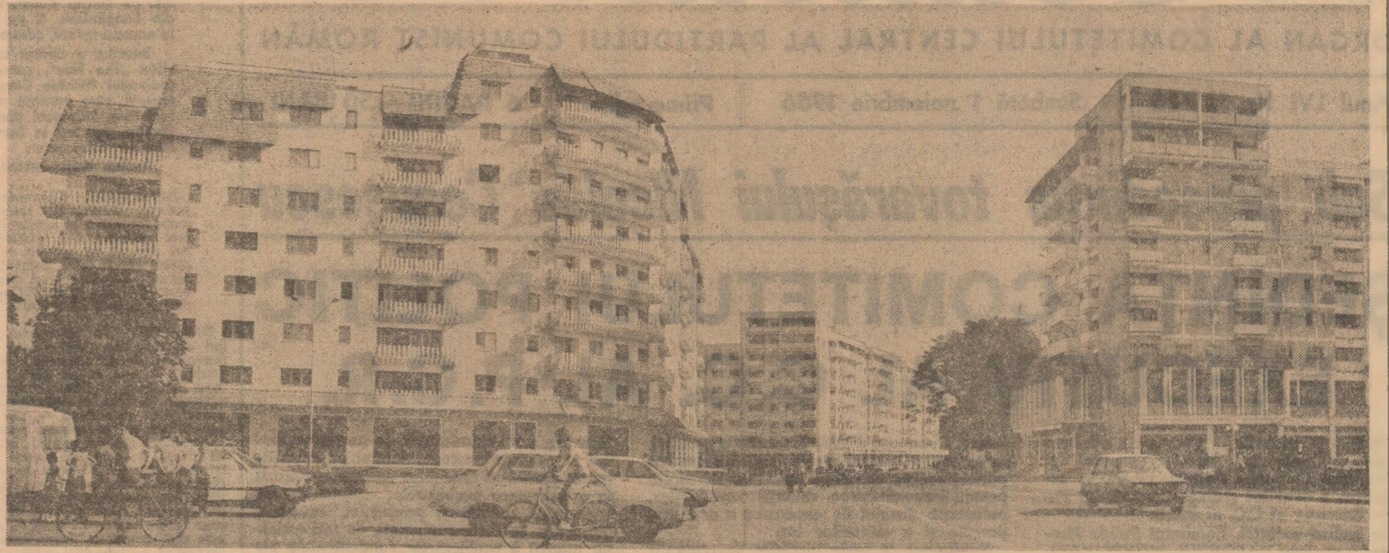
Roman, oraș multiseclar ce oferă astăzi o imagine grîitoare a civilizației socialiste

Abia în anii socialismului Moldova și-a șters lacrimile de pe obraz și și-a pruit cu seninătate chipul în oglinda vremii. De uitat n-a uitat nimic. Cu atît mai mult ne răscose aceste pagini înscrise cu sînge și cu foc în memoria Moldovei, ca și a întregii țări, care realizează de pace la Romîniei se reafirmă printr-un demers istoric — reducerea cu 5 la sută a armamentelor, efectivelor și cheltuielilor militare — cu voiaja fermă, unanimă, ca asemenea drame să nu se mai repete. Astăzi, cînd Moldova zilelor noastre, înfiorată ca niciodată în anii „Epocii Nicolae Ceaușescu”, trăiește ritmul întregi țări, doar filele îngulbenite de vreme mai eocod locuri unde nu s-a înfrîngat nimic”. Cu mărturie a roadelor politicii partidului nostru de dezvoltare armonioasă a tuturor zonelor patriei sînt și două dintre localitățile situate în această zonă geografică — Roman și Pașcani.