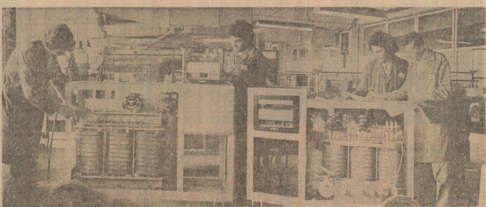
Întreprinderea de contactoare din Buzău. Se verifică o instalație destinată exportului