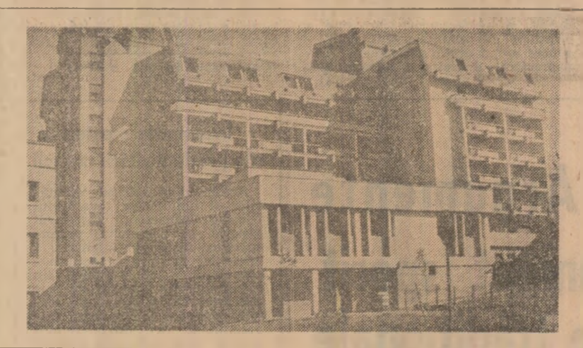
(Urmare din pag. 1)

Obținerea acestor rezultate a fost posibilă încă din anul 1935, cînd la nivel județean s-a creat un organism exclusiv la cel județean, s-au întocmit programe speciale privind întîrirea autoconducerii, autogestunii economico-financiare și autofinanțării unităților administrativ-teritoriale. În anul 1968, s-a realizat o nouă etapă concretă. Aceste măsuri au fost corelate cu cele cuprinse în Programul privind dezvoltarea economico-socială în profil teritorial, în Programul privind dezvoltarea economico-socială în profil teritorial, în Programul privind dezvoltarea economico-socială în profil teritorial, în Programul privind dezvoltarea economico-socială în profil teritorial.