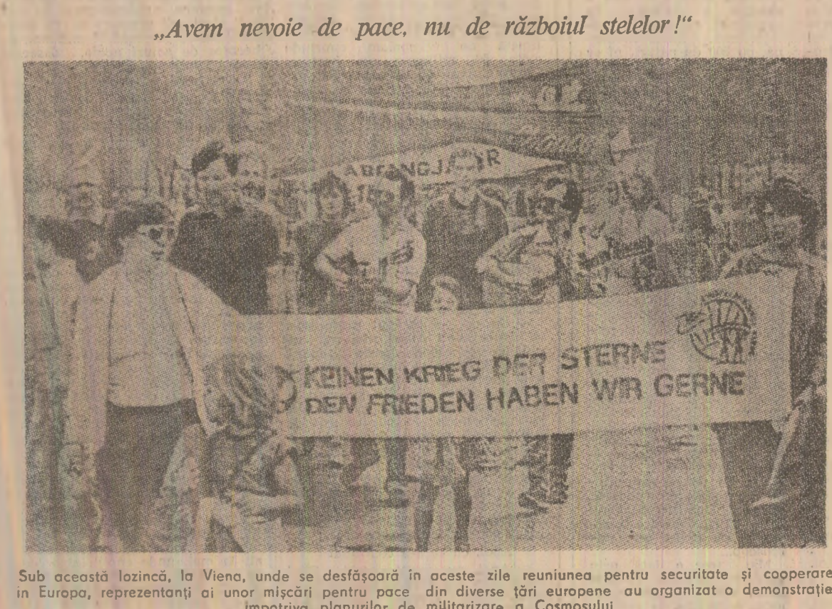
Sub această lozincă, la Viena, unde se desfășoară în aceste zile reuniunea pentru securitate și cooperare în Europa, reprezentanți ai unor mișcări pentru pace din diverse țări europene au organizat o demonstrație împotriva planurilor de militarizare a Cosmosului