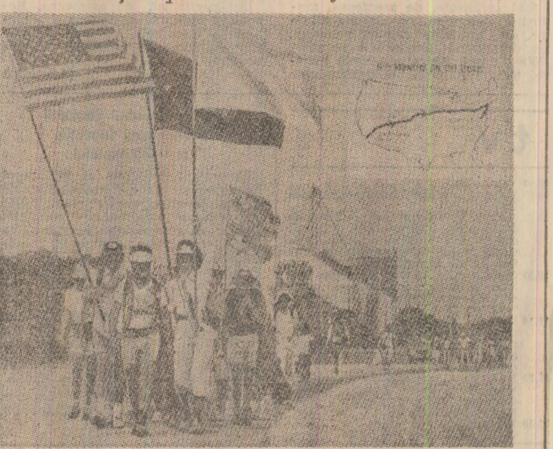
Recent, s-a încheiat marșul al păcii care, început la Los Angeles cu peste 8 luni în urmă, a avut ca punct terminus Washingtonul, unde s-a desfășurat un uriaș miting în sprijinul unei lumi eliberate de spectrul distrugerii nucleare