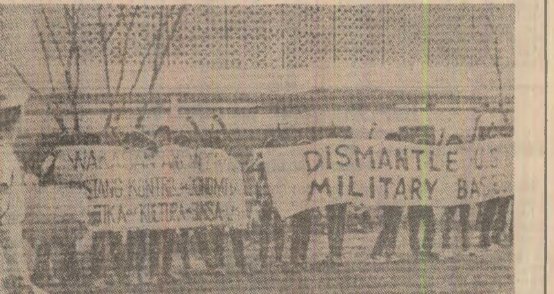
Intr-o altă regiune a lumii, în sud-estul Asiei, participanții la o manifestație de masă care a avut loc la Manila s-au pronunțat pentru desființarea bazelor militare străine de pe teritoriul Filipinelor