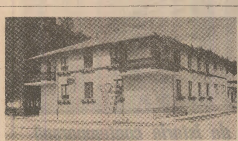
În fotografie: hanul Rucăr, din județul Argeș.

Desigur nu generalizăm, pentru că — așa cum realitatea o dovedește, cum fiecare poate constata zilnic pe traseele pe care călătorește — marea majoritate a călătorilor manifestă spirit civic, dau dovadă de un comportament civilizată în calitate de beneficiari ai serviciilor I.T.B. Este, de altfel, un lucru firesc, ce se însere în normele generale de comportare în societate. Din păcate însă, mai sînt unii călători care, mai ales profitînd de aglomerații în vehicule, de îngheț, de ceață, de ploaie, de zăăză, frauduloase ori dau frîu liber comportamentului necivilizat. Dincolo de violarea condițiilor de călătorie pentru publicul larg, aceste manifestări afectează înseși posibilitățile de perfecționare a transportului în comun, creșterea grăutății suplimentare care se răsfrînge asupra călătorilor însuși, acestora devenind, de fapt, victimele celor turburări. Pentru de exemplu, susținerea pe o suprafață a biletului de călătorie ori degradarea interiorului vehiculelor duc la pagube, la retragerea și imobilizarea mașinilor în garaje pentru reparări, șterbese bugetul I.T.B., diminuîndu-i întreprinderii posibilitățile procurării de noi mijloace de transport, întreprinții corespunzătoare a celor existente.