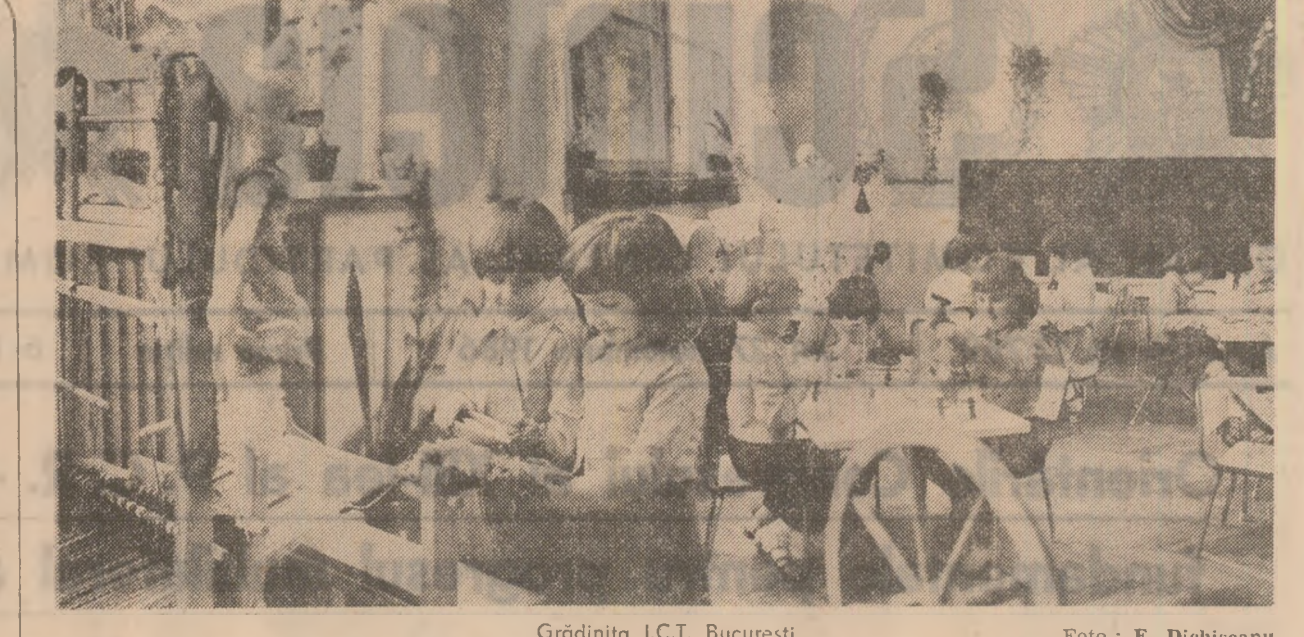
Grădinița I.C.T. București.

Din Vîlcea, o scrisoare adresată tovarășului Nicolae Ceaușescu, semnală că în cadrul județului s-au construit ilegal mai multe baze de agrement și cabane care sunt folosite în special de cadre de conducere ale întreprinderilor ce le-au amenajat. Autorul scrisorii își susține afirmațiile cu fapte și date concrete. La indicația secretariatului general al partidului, scrisoarea a fost dată spre rezolvare având în vedere Curții Superioare de Control Financiar și secretariatului de resort al C.C. al P.C.R. Raportul de cercetare confirmă unele din aspectele semnalate, persoanele vinovate de nerespectarea normelor legale fiind sancționate, stabilindu-se, totodată, măsuri pentru remedierea situației obiectivelor respective. Dar să dăm cuvântul faptelor. Combinatul chimic din Rimnicu Vîlcea, fără a avea documentațiile tehnico-economice și financiare la bancă, a amenajat o „bază de agrement și recuperare a forței de muncă”, pe malul lacului de acumulare de lângă Ot. în zona comunei Dăești — satul Pedelosoiu, cuprinzând o cabană cu 4 camere — în curs de execuție la data verificării — 13 căsuțe din diverse materiale metalice și lemnose, 3 anemii pentru servii masa, bazin de înot, piscină, debordare. Baza a fost executată în cea mai mare parte cu materiale provenite din recuperarea și reconstrucția din dezafectarea unor obiective război, iar altele s-au adevărat doar în parte. Fapt este însă că au fost folosite cauzele șantite prejudiciu financiar statului, evidența con-