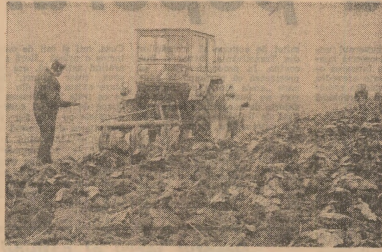
La ferma Belciug, a C.A.P. Drăgănești, arăturile se execută pe ultimele suprafețe