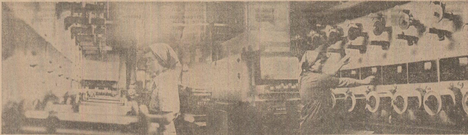
Prin autototare: O INSTALAȚIE DE MARE RANDAMENT

Nicolae BABALĂU correspondentul „Științei”