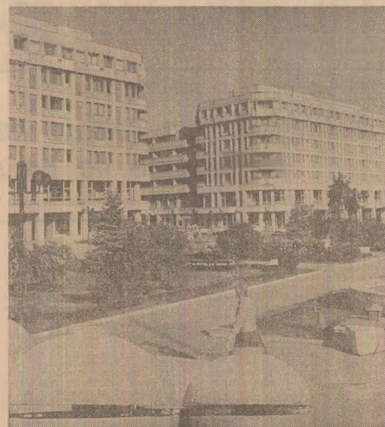
De la începutul acestui an în municipiul Ploiești s-au mutat în casă nouă aproape 3.000 de oameni ai muncii. Pînă la sfîrșitul anului încă 700 urmează să-și primească casa nouă. În același timp, la parterul noilor și modernelor blocuri construite în acest prim an al actualității cinci ani au fost realizate aproape 45.000 mp suprafață comercială, în mod deosebit în unități prestatoare de servicii. (Ioan Marinescu, corespondentul „Scinteii”)

Colectivele de muncă din cadrul întreprinderii de construcții industriale din județul Timiș, care și-au depășit sarcinile de plan la zi în activitatea de construcții-montaj cu aproape 40 milioane lei, anunță punerea în funcțiune a unor importante obiective de producție. Este vorba de noua turnătorie de la Întreprinderea metalurgică „Ciocanul”. Nădrag și instalația de apă oxigenată din cadrul Combinatului petrochimic „Solventul” Timișoara. În acest fel, numărul capacităților și obiectivelor noi racordate în acest an la circuitul economic al județului Timiș se ridică la 220. Între acestea, se numără 25 de noi sonde de liti la Șcheia de producție petroliferă Sandra, instalațiile de prelucrare a boabe de soia și de produs ulei vegetal rafinat la Întreprinderea de liti Timișoara, noile capacități pentru fabricarea de echipamente la Întreprinderea de aparate electrice de măsurat și de fire de vigoană la Întreprinderea textilă Timișoara. (Cezar Ioana).