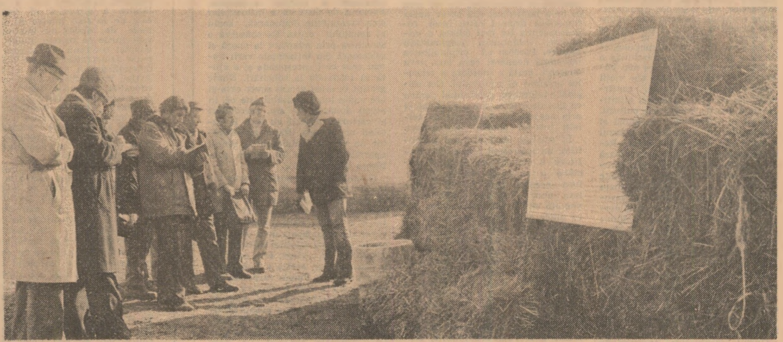
Pe baza programului de măsuri privind organizarea, desfășurarea și conținutul învățămîntului agrozootehnic de masă și instruirea cadrelor din agricultură, la cooperativa agricolă Alumați din sectorul agricol Ilfov a avut loc o demonstrație practică privind prepararea nutrienților groșieri în vederea îmbunătățirii calității acestora.