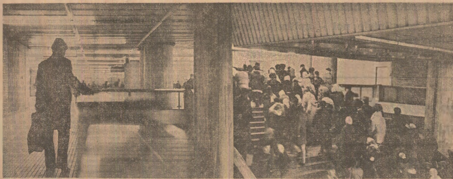
Poate că în suavoiele de oameni care beneficiază zilnic de serviciile metroului bucureștean or fi și alți asemenea pasageri sfioși, retrași, pentru care călătoria cu metroul înseamnă mai mult decît un simplu drum. Înseamnă ceva din ființa lor. Ca și pentru eroii însemnării de mai jos