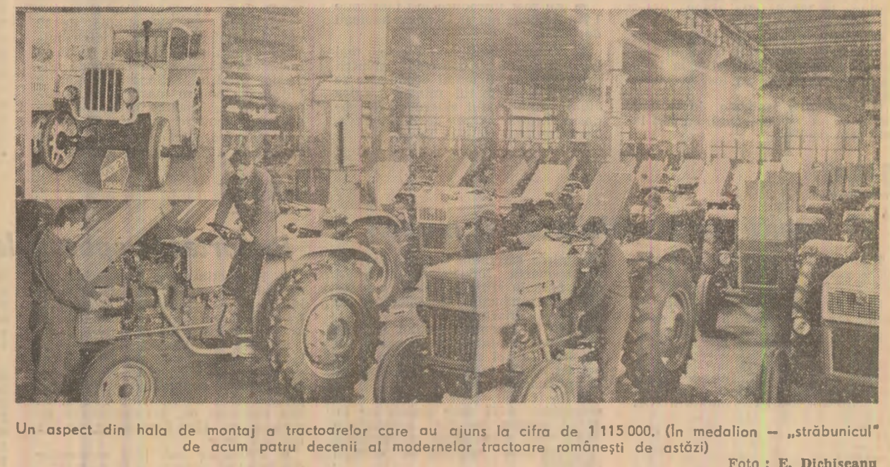
Un aspect din sala de montaj a tractoarelor care au ajuns la cifra de 1 115 000. (În medalia — „străbunicul” de acum patru decenii al modernelor tractoare românești de astăzi)