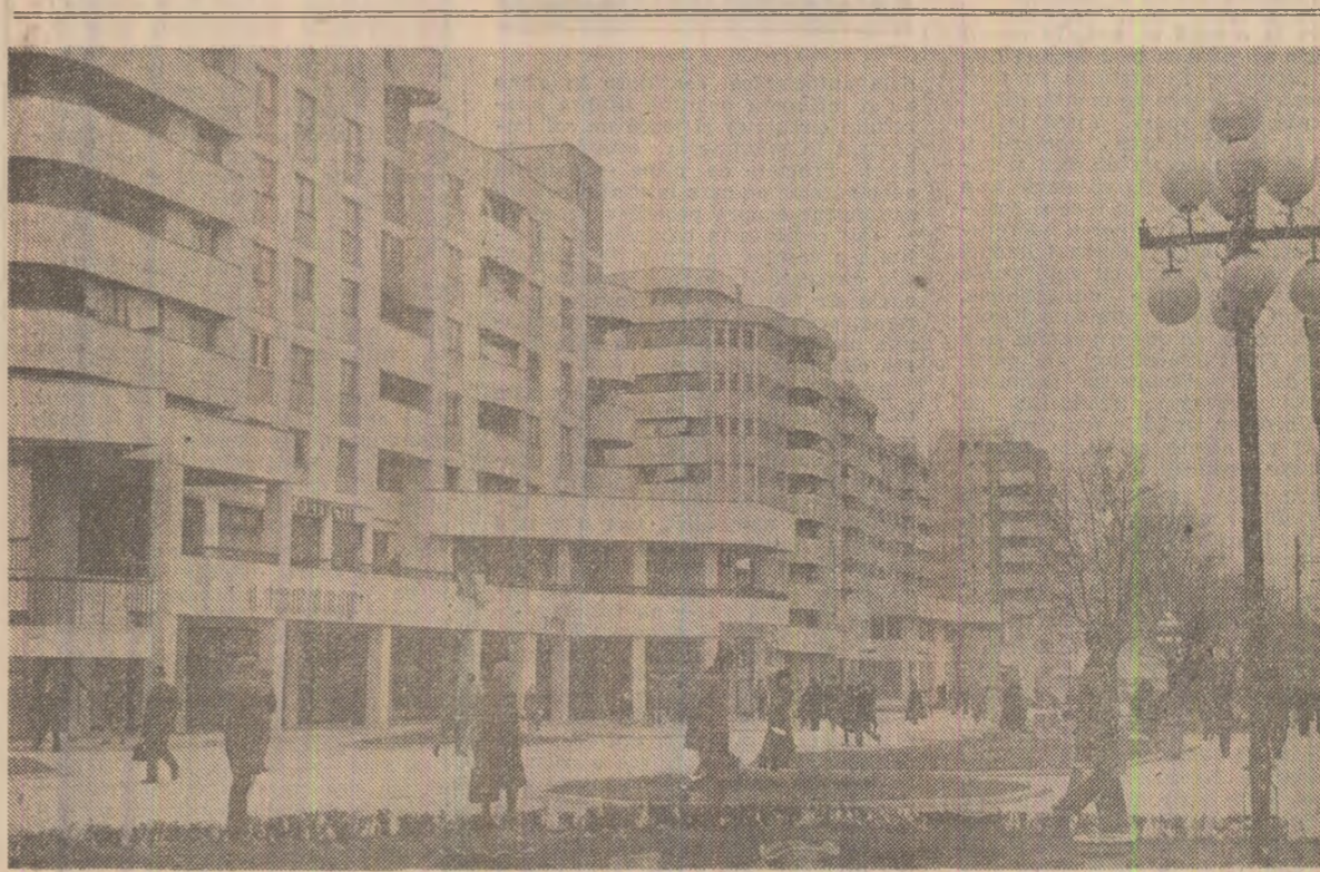
Din noua arhitectură a municipiului Alexandria

Conf. univ. dr. Ion ARDELEANU (Continuare în pag. a IV-a)