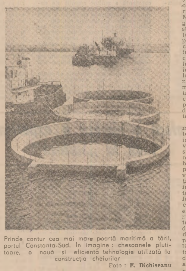
Prinde contur cea mai mare poartă maritimă a țării, portul Constanța-Sud. În imagine: chesoanele plutitoare, o nouă și eficientă tehnologie utilizată la construcția cheilor