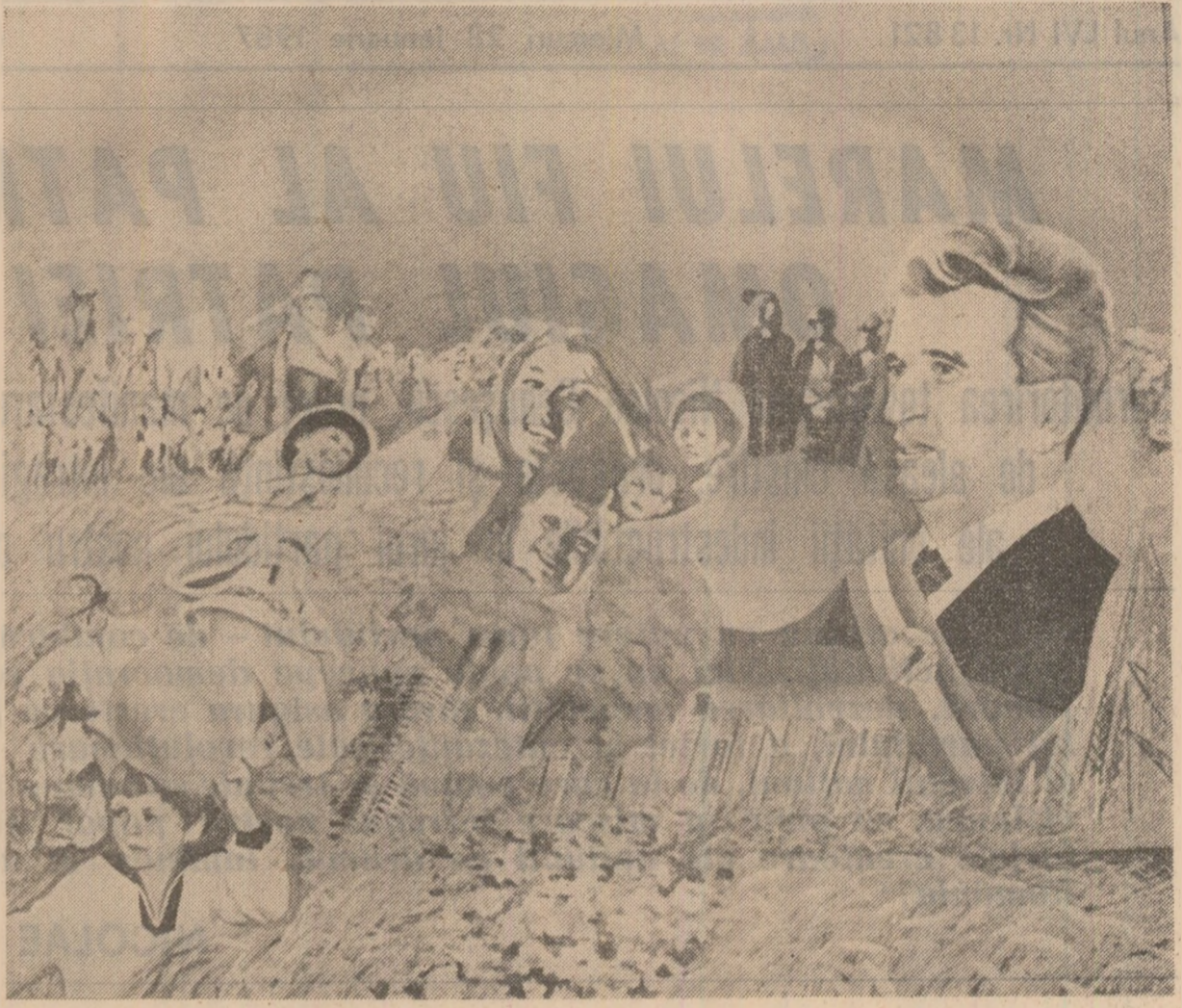
Alături de toți cetățenii patriei noastre, aducem un omagiu fierbinte celui de numele căruia sînt indestructibil legate cele mai mari împliniri din îndelungata istorie a României, conducătorului înțelept, militanț, strălucit pentru demnitatea și fericirea poporului român. Luminosoase sale prezențe în fruntea partidului și a țării, faptelor sale de istorică măreție și aleasă omnia le-am dedicat, drept omagiu de înaltă prețuire, lucrări de artă — între care și cea de față — în adresăm din inimă urare de „La mulți ani!”, spre binele și prosperitatea patriei, spre gloria eroicului nostru popor.

Unit, sub tricolor, în jurul marelui său conducător, poporul român dorește, ca-n veacuri, „bună pace!” pentru cămine și cîmpii, pentru muncă și flori, pentru orășe și sate, pentru mărețiile citorilor ce au schimbat fața pămîntului românesc în această relativ scurtă, dar glorioasă epocă. „Pămîntul României, oamenii lui, pacea sufletelor li și creației cinsteșce, prin pana poezilor, personalitatea eroului românesc și universal, tovarășul Nicolae Ceaușescu”, fiindcă pacea „E o lege a pămîntului” și „un imperativ al actualității” (Aurel Rău). „Facerea propriei noastre istorii, de la genă și pînă astăzi, nu reprezintă altceva decît împlinirea vocăției noastre pasnice și constructive. Mai avem încă multe de împlini, căci drumul libertății noastre e abia la început. De aceea, dorința nestrămutată de pace face parte din însăși rosturile adînc ale existenței noastre ca patrie și popor. Iată de ce chemarea Președintelui țării, a tovarășului Nicolae Ceaușescu la luptă hotărîți, alături de toate popoarele lumii, pentru oprirea cîrnelor înarmărilor, pentru dezarmare, pentru pace — e chemarea rațiunii noastre de a fi, expresia cea mai elocventă a vocăției constructive a poporului român” (Dumitru Ghișe). Dreptul la pace, la viață, la afirmarea virtuților constructive constituie însăși esența ființei umane: „Președintele Nicolae Ceaușescu rostește adevărul esențial al vieții, unul pentru