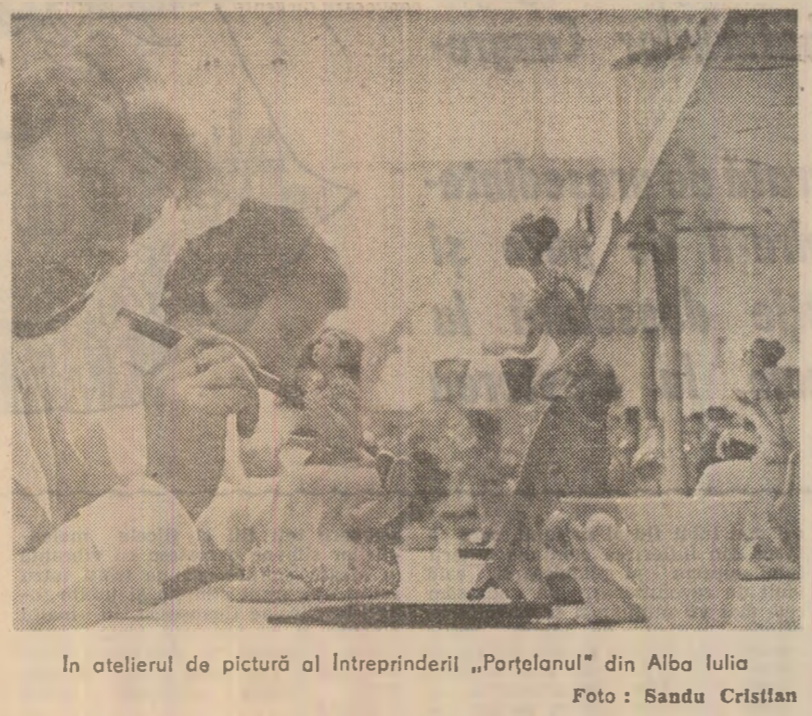
În atelierul de pictură al Intreprinderii „Porțelanul” din Alba Iulia