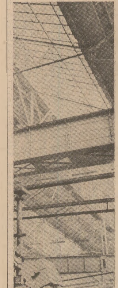
În pagina a 2-a, un comentariu de la adunarea generală a oamenilor muncii de la întreprinderea „Timpuiri noi” din Capitală.