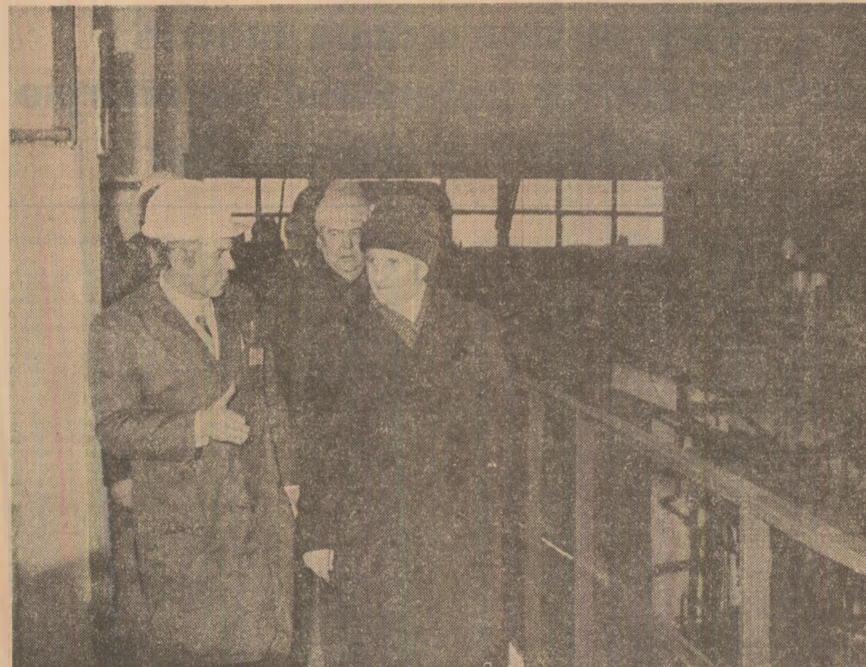
În timpul vizitei la Centrala electrică de termificare și Întreprinderea de vagoane