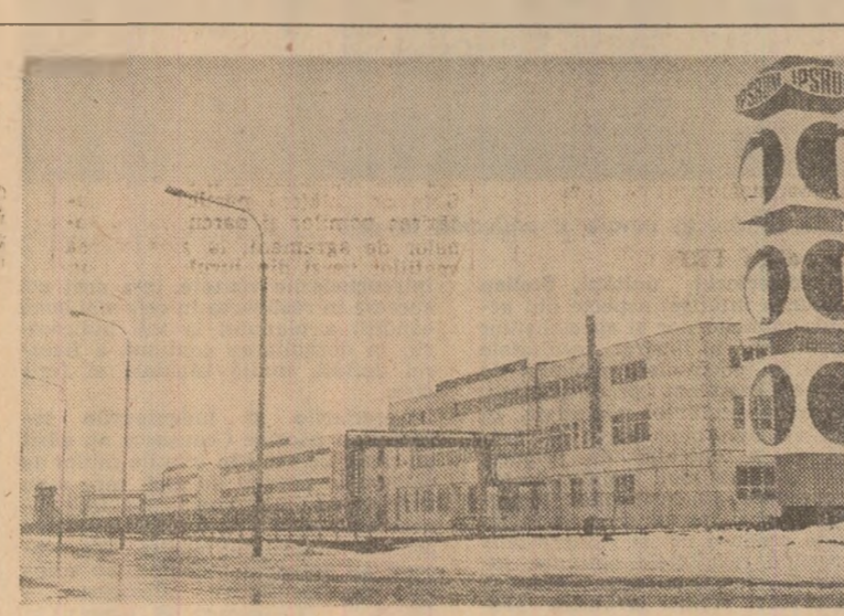
Noiu Intreprindere de piese de schimb și reparații de utilaj minier din Devo

5. Activitatea de control pe fluxul de fabricație și verificări finale se