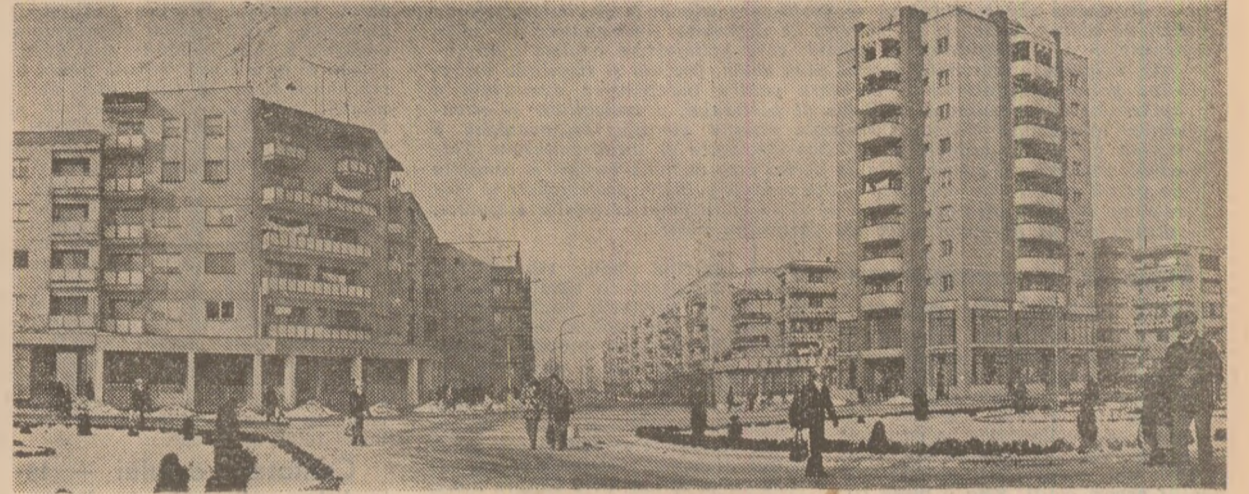
Nol constructii de locuinte la Birlad

Presedintele Republicii Socialiste România, tovarășul Nicolae Ceaușescu, a primit joi, 5 martie, pe Stephen Chiketa, care și-a prezentat scrisorile de acreditare în calitate de ambasador extraordinar și plenipotențiar al Republicii Zimbabwe în țara noastră. (Continuare în pagina 5-a).