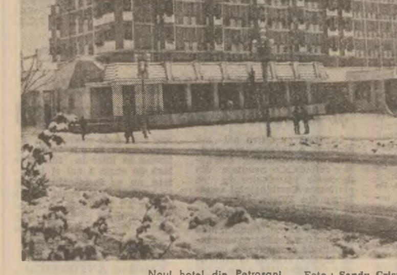
Noul hotel din Petroșani.

Dar, cum s-a văzut, se puteau face mult mai multe și mai bune comunități în comuna Crasna. În toate domeniile! Recunoșcînd aceasta deschis și fără echivoc, primarul