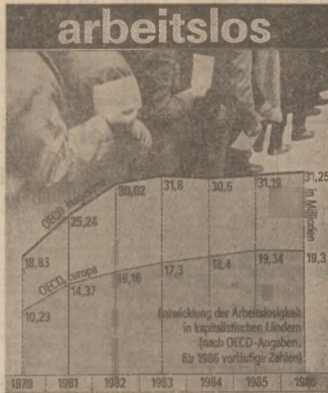
După datele furnizate de O.E.C.D. (organizație care cuprinde principalele țări ale lumii capitaliste), revista „Horizont” a întocmit graficul de mai sus privind evoluția șomajului în aceste țări în perioada 1979-1986. Curba superioară indică numărul șomerilor (în milioane) pe ansamblul O.E.C.D., iar curba inferioară situația în țările europene membre ale O.E.C.D.