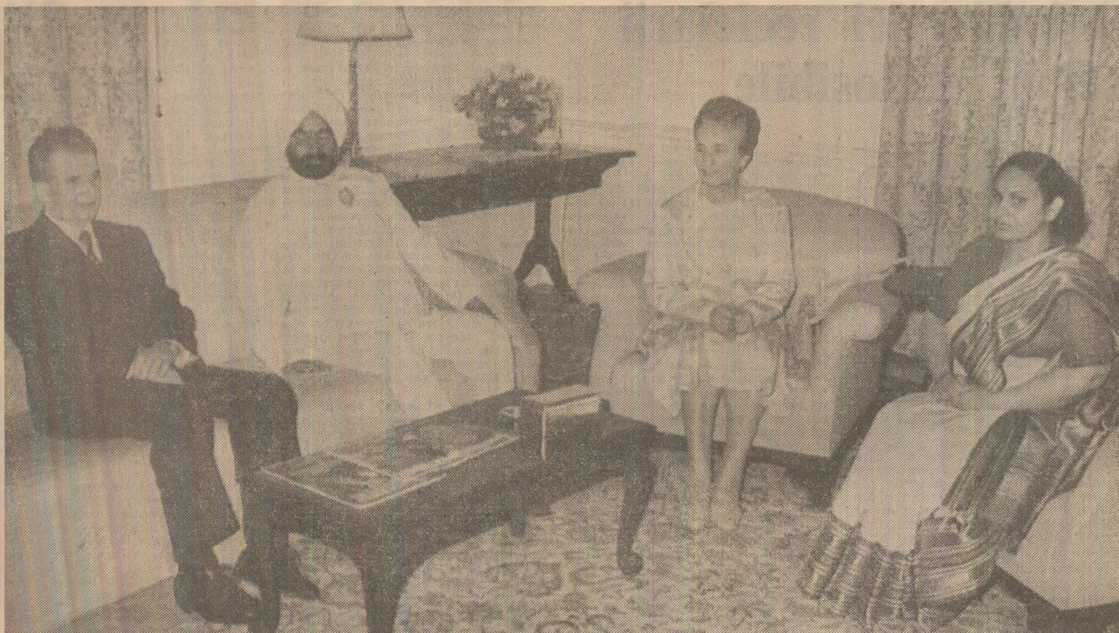
La reședința rezervată oaspeților români

La scara avionului, un grup de pionieri a oferit tovarășului Nicolae Ceaușescu și tovarășei Elena Ceaușescu frumoase buchete de flori. La ora 7,15, aeronava prezidențială a decolat îndreptîndu-se spre New Delhi.