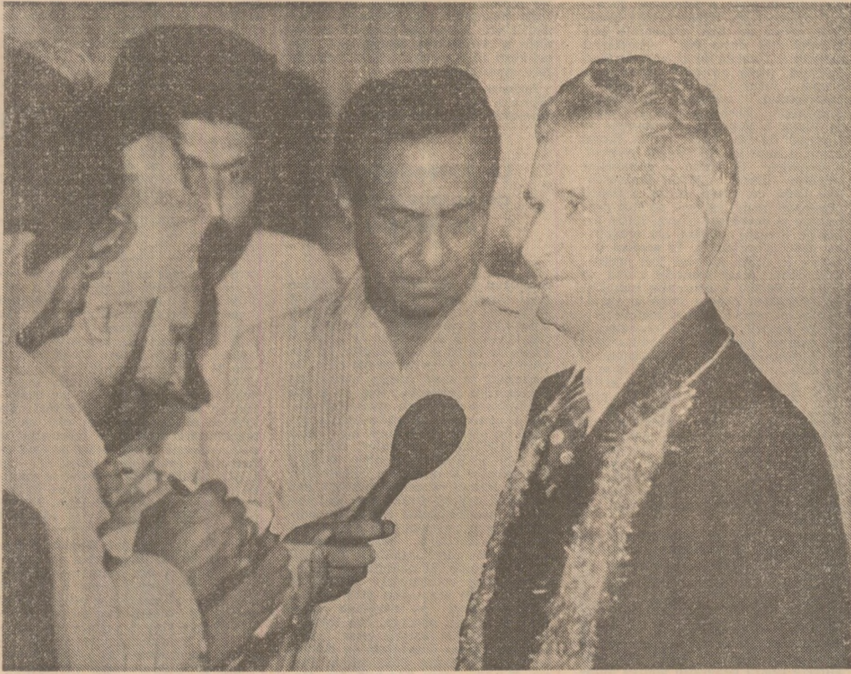
Pe aeroport, răspunzând la întrebările ziaristilor