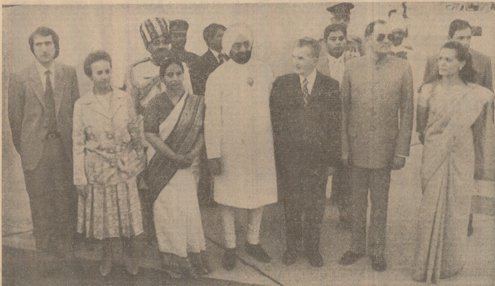
La sosirea pe aeroportul din capitala Indiei

Sosirea la New Delhi „Din inimă, un călduros «Bun venit!»“