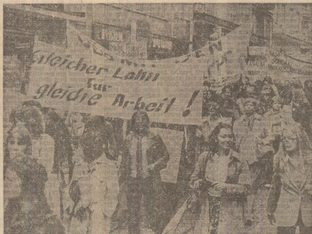
Această lozincă reprezintă una din revendicările principale ale femeilor din numeroase țări occidentale, așa cum arată demonstrația de mai sus a femeilor din R. F. Germania