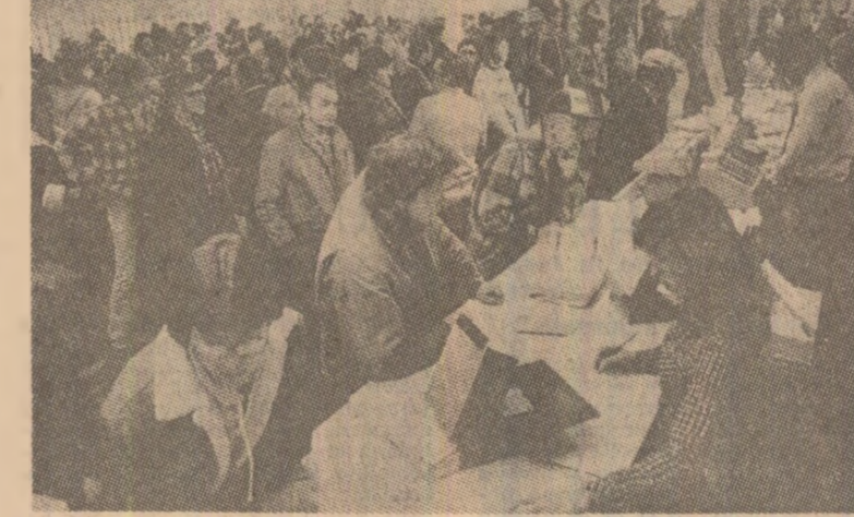
La unul din birourile de plasare din S.U.A., în căutarea, adesea zadarnică, a unui loc de muncă