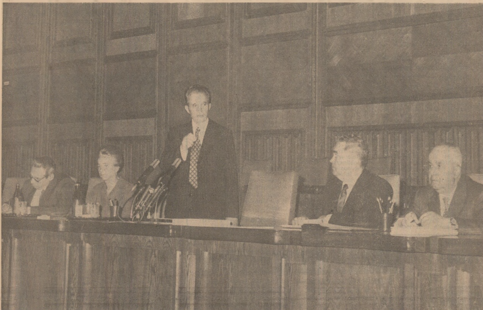
Sub președinția tovarășului Nicolae Ceaușescu, secretar general al Partidului Comunist Român, președintele Republicii Socialiste România, în zilele de 6 și 7 aprilie, la C.C. al P.C.R. au avut loc succese — pe domeniul de activi-

tate și în plen — consfătuiri de lucru cu consiliile de coordonare din ramurile construcțiilor de mașini, metalurgiei, chimiei, petrochimiei și industriei ușoare, minerului și petrolului și geologiei, energiei electrice și termice, precum și