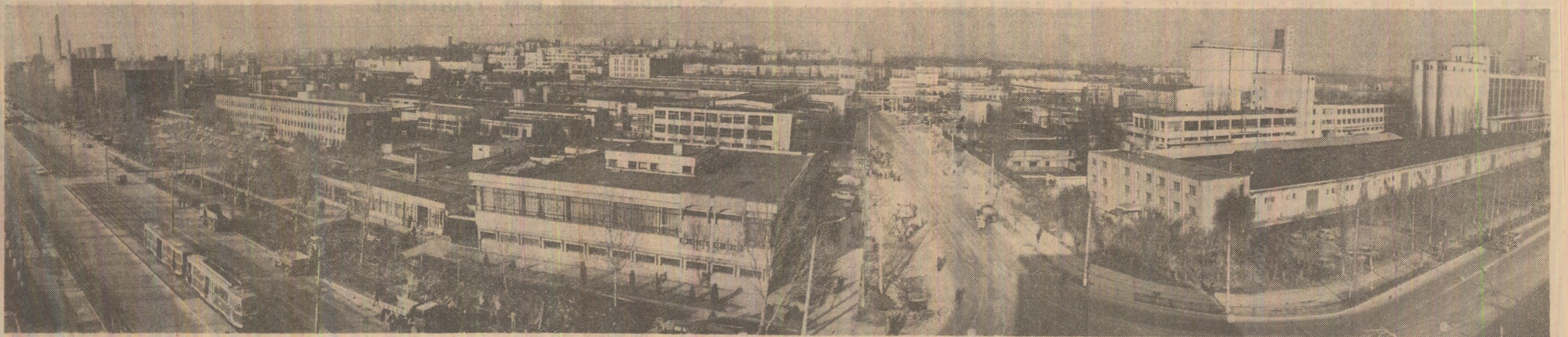
Din noul peisaj industrial al patriei

Cuvîntarea secretarului general al partidului a fost urmărită cu deosebită atenție și viu interes, fiind subliniată cu puternice aplauze.