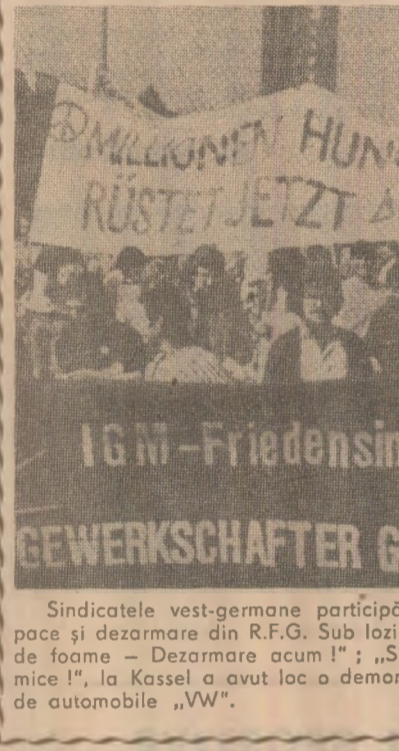
Sindicatul vest-german participă activ la ampla mișcare pentru pace și dezarmare din R.F.G. Sub lozinci ca : „Milioane de oameni suferă de foame — Dezarmare acum !” ; „Sindicatul împotriva rachetelor atomice !”, la Kassel a avut loc o demonstrație a muncitorilor de la o uzină de automobile „VW”.