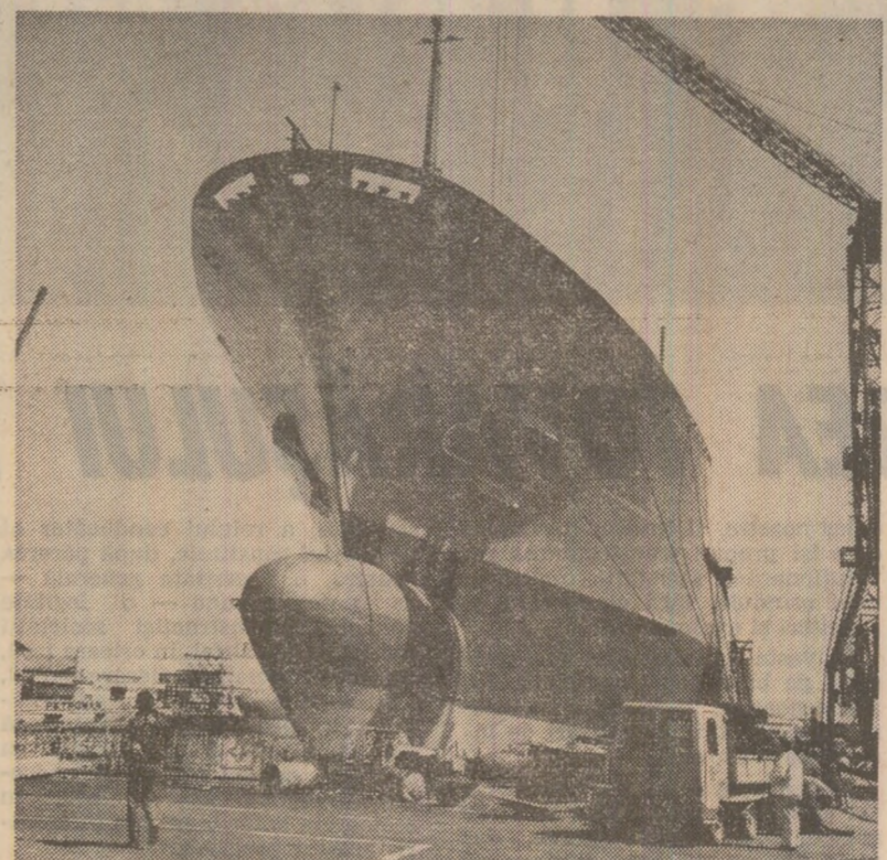
GALAȚI : Noi tipuri de nave