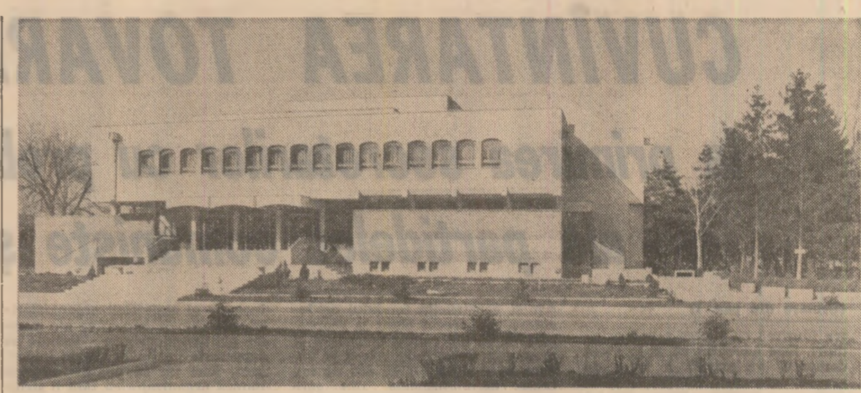
Casa științei și tehnicii pentru tineret din Roșiori de Vede

(de la „Jederman” la „Faust” și de la Brecht la teatrul sud-american). În lungul drum de întîmplări, situații contrastante (unele cu semnificații foarte clare, demonstrative, poate chiar prea lipsite de misterul, înofensivul vieții, atîte împotriva, funcții amabile, o lume de personaje grotesci, gravitînd în jurul unui erou central, deapănă aici o „poveste a omului”). Moralitățile medievale înscrise în vatră, acestea, cînd făcuse abstracție de ceea ce atunci înfrunghia Absolutul, de „cerul” principilor etice și asculta exclusiv de instincte, poște de învături sau de mîntuire, făcuse „procesul” omului care își pierde omnia, înclinarea spre rău și chiar alegra rău (tema ilustrată și în opera lui J. P. Sartre). Recredînd în chip original relații specifice capitalismului, insistînd în primul rînd pe determinări și mecanisme ale suferinței și manipu-