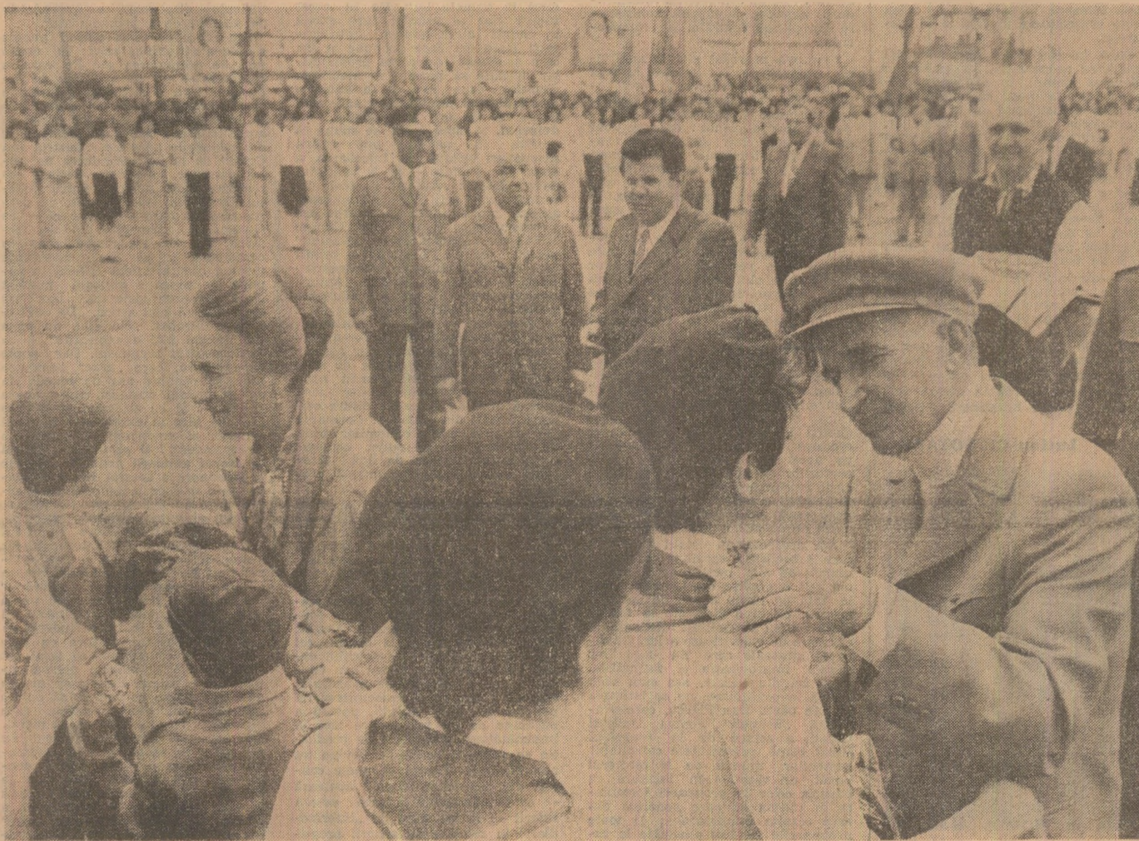
Tovarășul Nicolae Ceaușescu, secretar general al Partidului Comunist Român, președintele Republicii Socialiste România, împreună cu tovarășa Elena Ceaușescu, a început, joi după-amiază, o vizită de lucru în județul Argeș.

Vizita se desfășoară în atmosfera de puternică angajare patriotică a oamenilor muncii din acest județ, care, asemenea întregului nostru popor, achionează cu dăruire, cu pașos revoluționar pentru îndeplinirea în cele mai bune condiții a sarcinilor de plan în industrie, agricultură, în celelalte sectoare de activitate, pentru înfăptuirea integrală a obiectivelor stabilite de Congresul al XIII-lea al Partidului Comunist Român.