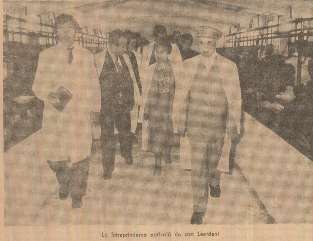
La întreprinderea agricolă de stat Leordeni

In acest sens, s-au evidențiat eforturile depuse și rezultatele obținute în îndeplinirea planului pe perioada care a trecut de la începutul anului. Totodată, au fost relevate, în spirit critic și aut critic, o serie de lipsuri din muncă unor întreprinderi și unități agricole din județ, evidențindu-se măsurile luate pentru lichidarea neînfrizată a neajunsurilor și îmbunătățirea radicală a întregii activități.