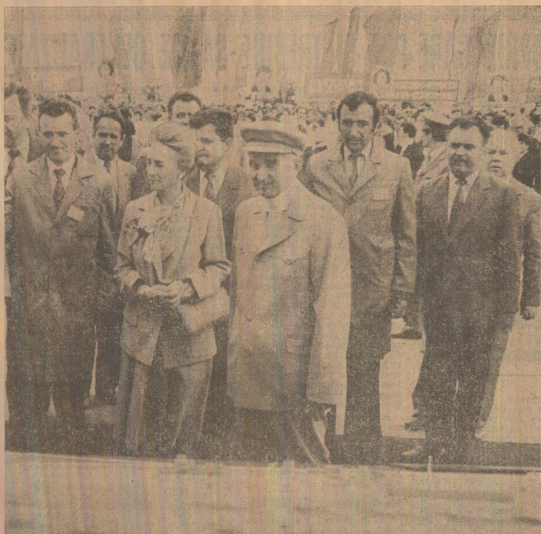
La Combinatul petrochimic Pitești

„Ceaușescu și poporul!”, „Stima noastră și mîndria, Ceaușescu — România!”, „Ceaușescu — pace!”. Tinerii, pionierii și soimii ai patriei au încolțit cu emoție pe tovarășul Nicolae Ceaușescu, pe tovarășa Elena Ceaușescu, oferindu-le buchete de flori. O formație alcătuită din membri ai gărzilor patriotice și ai detașamentelor de pregătire a tineretului pentru apărarea patriei a prezentat onorul. După data străbună, tovarășul Nicolae Ceaușescu și tovarășa Elena Ceaușescu au fost intimpinați cu pline și sare de un bătrîn localnic. (Continuare în pag. a III-a)