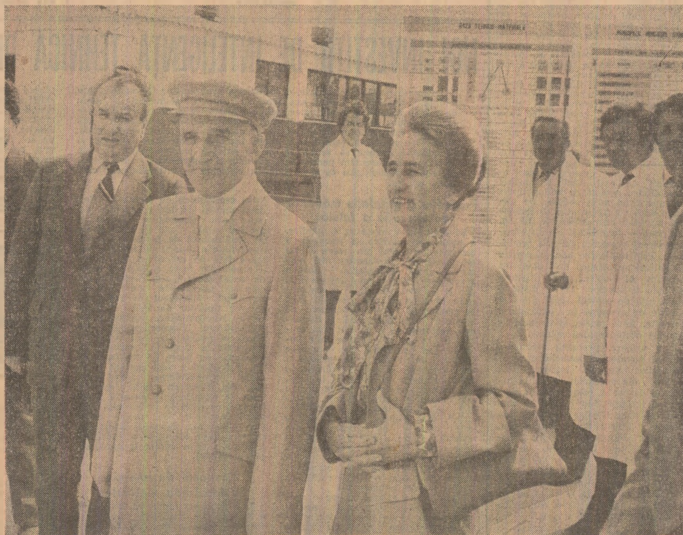
La întreprinderea agricolă de stat Leordeni