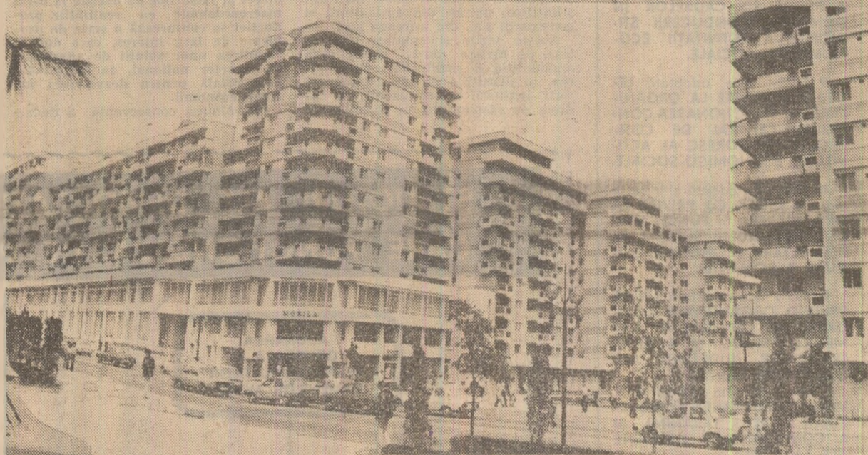
Din noul peisaj al municipiului Pitești