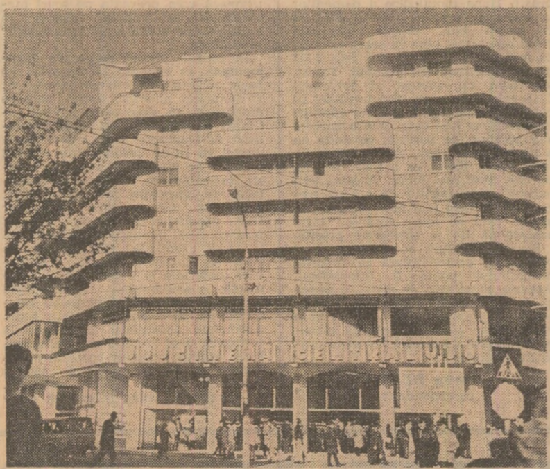
Din noul peisaj arhitectonic al municipiului Brăila.

Colectivul de muncă de la Întreprinderea minieră Bălan, județul Harghita, depune eforturi susținute pentru îndeplinirea angajamentelor asumate în trecerea socialistă, stîind în prim plan realizarea și dezvoltarea planului în producția fizică. Organizarea superioară a muncii și promovarea unor tehnologii noi de lucru, repartizarea mai bună a specialiștilor în cele 3 schimburi, creșterea indicelui de utilizare a mașinilor și utilajelor, ca și extinderea metodei de exploatare în subetape au asigurat realizarea în acest an, peste prevederi, a 5.000 tone minere extras și prelucrat, 69 tone cupru, peste 250 tone sulf. La producția-marfă, sarcinile de plan sînt depășite cu peste 10 milioane lei. (Nicolae Sandru).