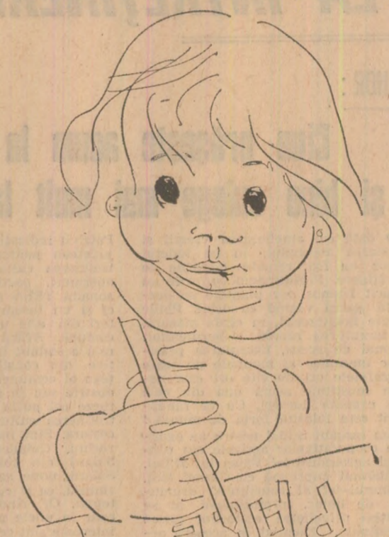
Desen de TIA PELTZ

Prima zi de lunie este considerată și sărbătorită ca ziua tuturor copiilor lumii. Dincolo de barierele geografice, de granițele de orice fel, de deosebiri de orânduire socială în care trăiesc, de culoarea pielii, de limbă și tradiții, privirea locuitorilor adevărați ai planetei se îndreaptă, cu multă dragoste părintească și înaltă răspundere, către copiii. Căci ei reprezintă viitorul, perpetuarea umanității în timp, și înțeleg mai departe făclia progresului, a civilizației și a culturii. Iunie este ziua când în ochii limpezi ai copiilor trebuie să se reflecte mai adânc și mai strălucitor, ireversibilă bucurie a viștelor. Încrederea deplină în viitor, lumina unui cer fără nori, pururi senin.