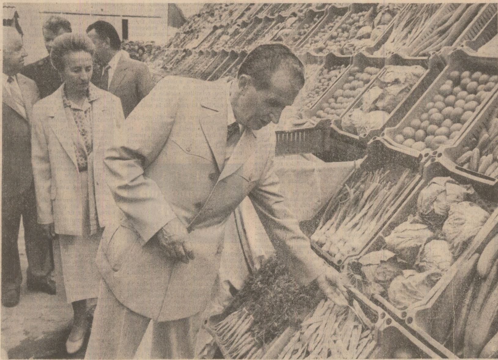
(Urmare din pag. a II-a)

încercărilor sale conducătoare, al patriei noastre socialiste. Coruri reușite interpretat cîntec patriotic, revoluționar. Ambianța sărbătorască de pe stadion era întregită de formații artistice, ce executau dansuri specifice folclorului din această parte a țării.