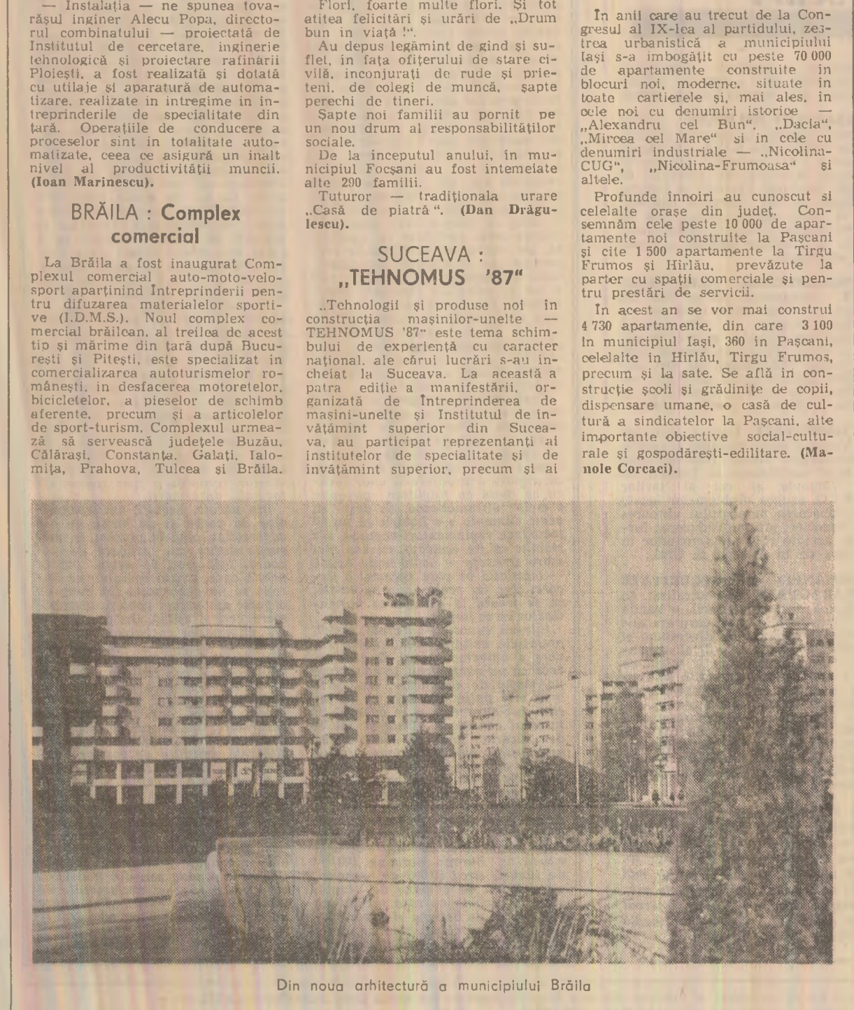
Din noua arhitectură a municipiului Brăila