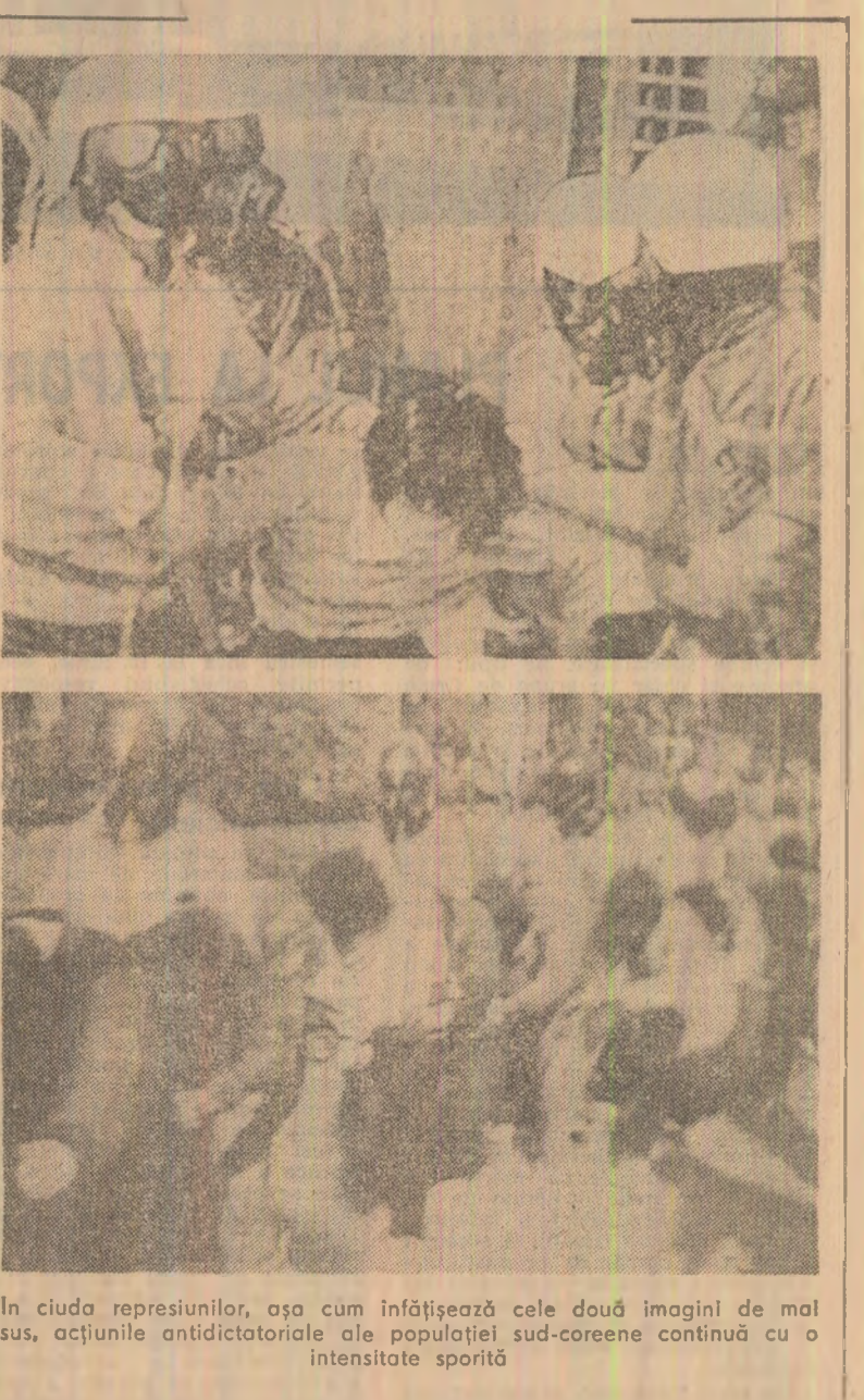
În ciuda represiviunilor, așa cum înfățișează cele două imagini de mai sus, acțiunile antidictatoriale ale populației sud-coreene continuă cu o intensitate sporită