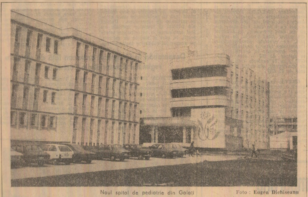
Noul spital de pediatrie din Golați.

„Ermee noastre se află în stare de război economic și sistem pe care să pierdem acest război”, anunță Ross Perot, miliardarul producător de computere în Texas, pe război economic. Perot, inventatorul firmei Electronic Data System, interzice invazia produselor industriale de înaltă prețuri din Europa și Asia de est.