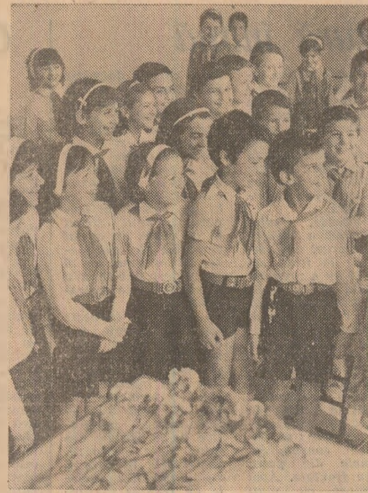
Într-o școală din sectorul 6 al Capitalei

de dezvoltare a spiritului creator, a inventivității și a puterii de anticipație tehnico-științifică. În cercurii de istorie, istorie contemporană ale prieteniei internaționale (UNICEF), de etnografie și folclor, activitatea este deosebit de rodnică: ea se concretizează, pe de o parte, în acțiuni politico-educative de masă, comemorînd evenimente istorice, politice sau evocînd măretele titluri ale „Epocii Nicolae Ceaușescu”; pe de altă parte, în debateri, sesiuni de reflecție și comunicări, întîlniri cu diferite personalități. Fructuoasă este și colaborarea dintre cercurile cu profil politic sau cele de etnografie și folclor cu Muzeul de istorie și artă al municipiului București, cu Muzeul satului etc. În cadrul „Clubului artelor” au loc, lunar, acțiuni de inițiere muzicală cu sprijinul unor profesori și formații de studenți de la Conservatorul „Ciprian Porumbescu”. Cele 32 de formații artistice și interpreti (aproape toate distinse cu premiul I la Festivalul național „Cîntarea României”) susțin o stagiu permanentă, cu spectacole bilunare; spectacole la care participă toate formații-