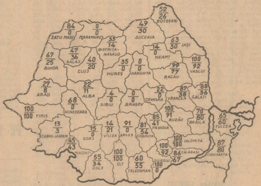
STADIUL LUCRĂRILOR DE ÎNȚEBINERE LA PORUMB. Cifrele înscrise pe hartă reprezintă, în procente pe județe, în seara zilei de 29 iunie, proporția în care au fost efectuate cea de-a treia prășită mecanică...