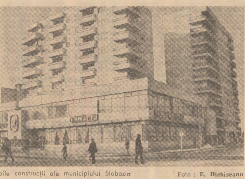
Din noile construcții ale municipiului Slobozia.

Dezbatările pe primele cinci luni ale acestui an dovedesc că angajamentul comitetelor O.D.U.S. de a depăși rezultatele anului trecut se îndeplinește, în acest interval, în județ au fost colectate și predate