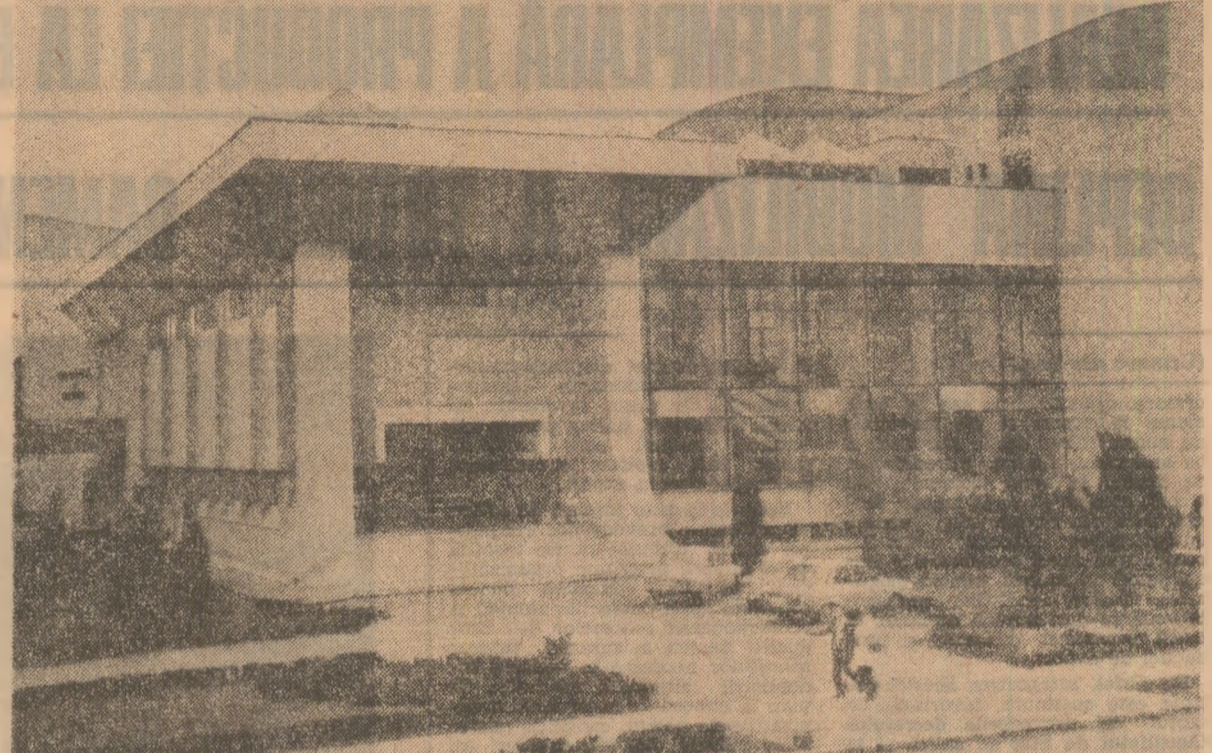
Casa de cultură din Sibiu.