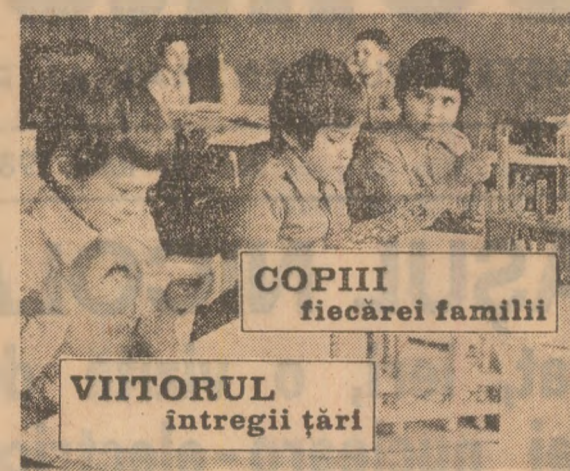
COPIII fiecarei familii VIITORUL intregii țări

„Desfășurăm o susținută muncă politico-educativă în rîndul familiilor, al tuturor cetățenilor — ne spune interlocutorul — în primul rînd pentru a promova o atitudine în-