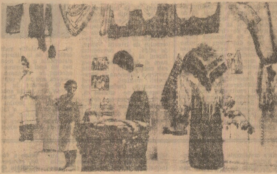
Expoziție de artă populară în cadrul Muzeului Satului din Capitală.