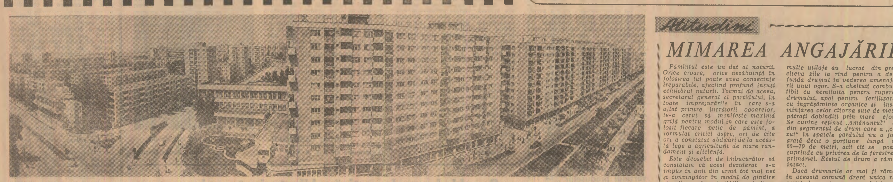
Urbanistică modernă la Slatina.