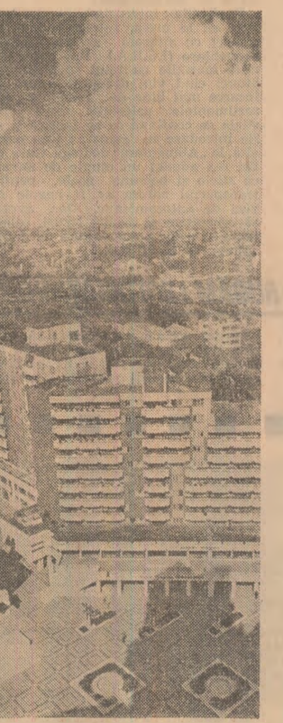
Din arhitectura municipiului Baia Mare.