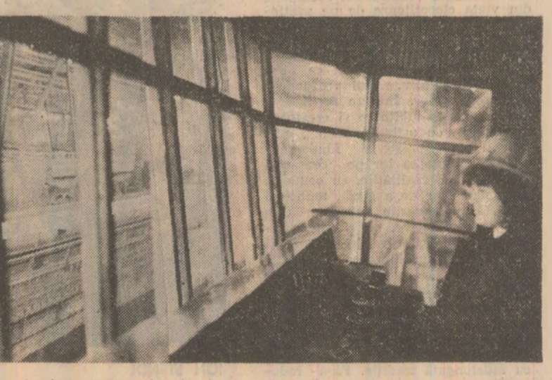
Combinatul siderurgic Hunedoara: aspect din hala laminorului de sirmă

Șigur, o serie de rezultate există. Dar sint acestea la nivelul maxim al posibilităților? Cit de relevantă este depășirea sarcinii de prelucrare sau redistribuirea stocurilor disponibile sau fără mișcare acum sarcinile de prelucrare a stocurilor supranormative, pe baza unor aprecieri destul de aproximative și a rezultatelor din anul precedent, prev-