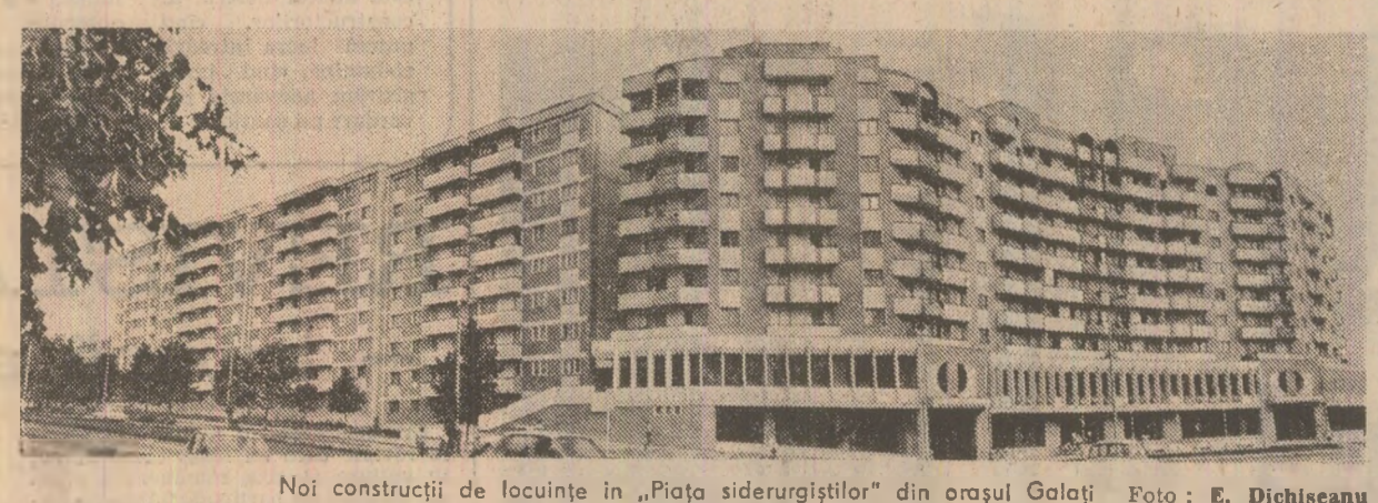
Noi construcții de locuințe în „Piața siderurgicilor” din orașul Galați.

● Mîndrie justificată. Cei aproape 30.000 de constructori argeșeni raportează cu mîndrie că pînă în prezent planul la investiții a fost îndeplinit în proporție de 102,4 la sută, iar la construcție montaj în funcțiune zece noi capacități de producție și parțial alte 13. S-au dat, de asemenea, în folosință aproximativ 1.600 de apartamente noi, planul fiind îndeplinit la acest capitol în proorție de 103 la sută. (Florea Tistu-teasa, Pitești). ● Seacă pe lac. Din inițiativa primului gospodar al urbei noastre, Fălticeni, și cu sprijinul neprețuit al tinerilor din oras, pe iazul de la Nada Florilor a fost construită o amenă fixată pe potoane; cu ajutorul unor cabluri aceasta poate fi trasă de la mal spre mijlocul apei pe o distanță de 50 m. Recent, în acest mirific peisaj, nemuri de pana măiestra a lui Șafoveanu, a avut loc inauzurarea scenei plutoare, prin prezentarea unui spectacol urmat de un mare număr de locuitori și realizat cu concursul echipelor artistice de amatori aparținînd unităților industriale ale orașului. Trei ore de poezie, cîntec și dans în aer liber, care s-au transformat, cum era și firesc, într-o amintire de neuitat. (Alexandru Chifacaru, Fălticeni).