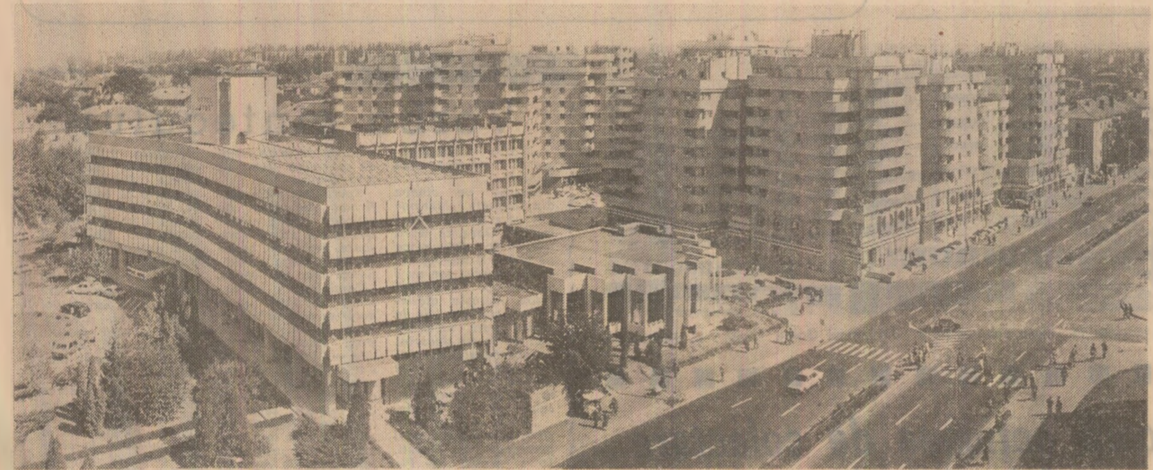
Municipiul Craiova, ca de altfel toate localitățile patriei, a cunoscut în ultimii ani o puternică dezvoltare urbanistică

nerii din Teluc și Ghelar, dornici să întîmpine marea sărbătoare de la 23 August și Conferința Națională a partidului cu rezultate de prestigiu, raportează noi succese în producție. Printre-o aprovizionare responsabilă a tuturor locurilor de muncă din subleran și din cartiere, prin organizarea judicioasă a proceselor tehnologice în toate schimburile și crearea unui climat de ordine și disciplină muncitorească în fiecare formație de lucru, colectivul Întreprinderii miniere Hunedoara a obținut de la începutul anului și pînă în prezent, peste prevederile de plan, aproape 7.000 tone fier în minereu marfă, peste 25.000 tone dolomită și talc pentru siderurgie. (Sabin Cerbu).