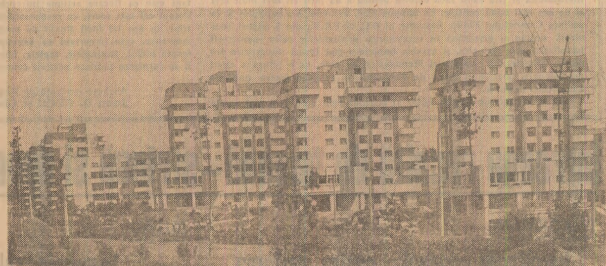
Un nou cartier de locuințe în municipiul Craiova