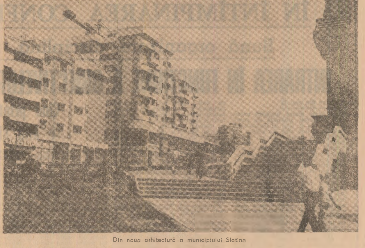
Din noua arhitectură a municipiului Slatina

de partid, ceilalți factori educaționali dispun de o largă paletă de mijloace de acțiune. Între acestea, un rol deosebit revine punctelor de documentare politico-ideologică. În lumina noilor exigențe pe care le-a formulat secretarul general al partidului la recentul Congres al educației politice și culturale socialiste am cercumscriș investigația desfășurată la punctele de documentare politico-ideologică din câteva unități industriale din municipiul Galați și orașul Găești.