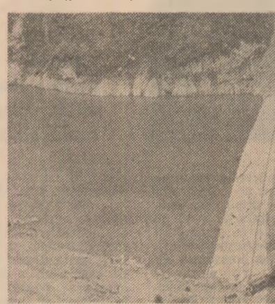
Barajul de anrocamente de la Colibița. O construcție de amploare care tinde să devină un nedorit record în materie. De zece ani se ridică și se tot ridică... numai că perspectiva finalizării în scurt timp a lucrărilor este încă incertă

Pe scurt, cînd și cu mulți alți astfel de „dacă” cu totul și cu totul nejustificați, cu totul și cu totul păgubitori și care au făcut ca