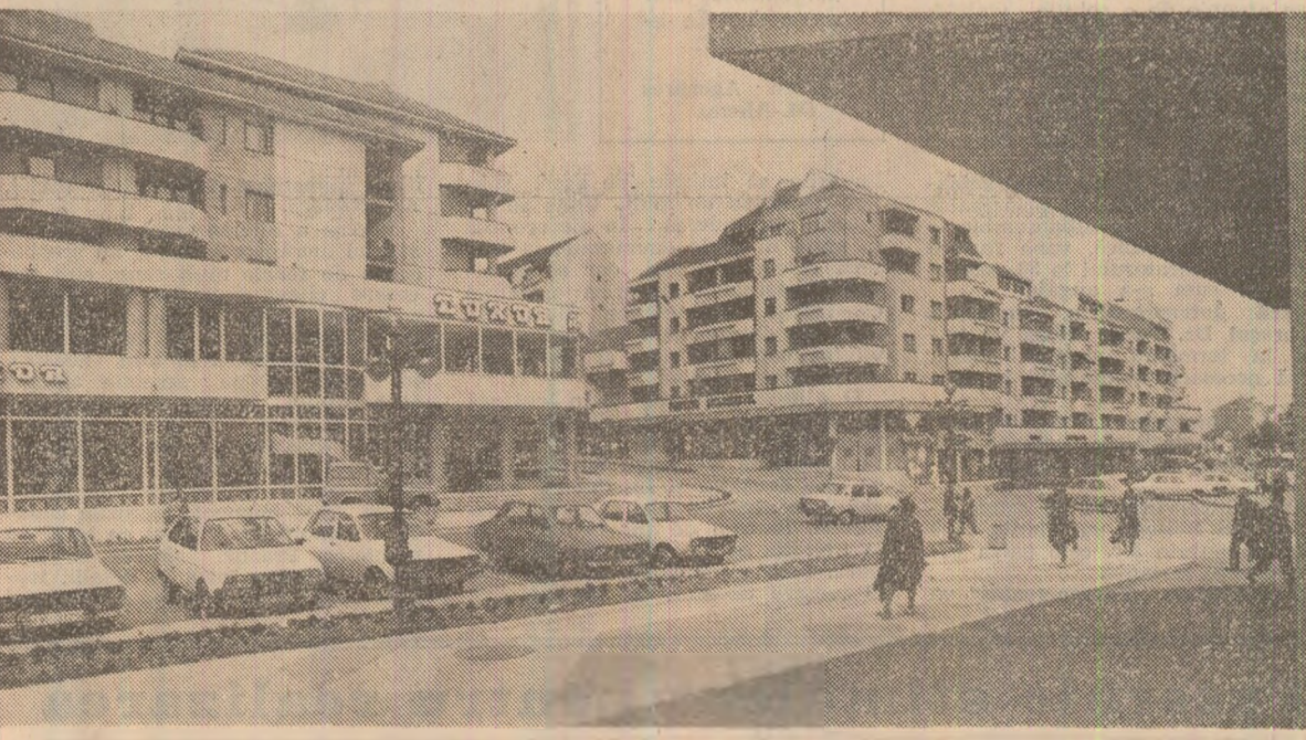
Rimnicu Vilcea, ca de altfel toate orașele patriei, a cunoscut în ultimii ani o puternică dezvoltare urbanistică

pectarea cu strictețe a amplasării grului și orzului după cele mai bune plante premergătoare. Esențial este acum ca, peste tot, comisiile înființate în fiecare unitate agricolă pentru organizarea și coordonarea desfășurării însămînțărilor de toamnă să stabilească forțele umane și mecanice necesare recolectării, astfel încît toate aceste terenuri să fie eliberate de culturile de bază până la data de 10 septembrie.