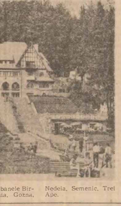
Semenic, cabanele Bircăza, Crivăia, Gozna, Nedea, Semenici, Trei Ape.

Oficiile județene de turism și T.H.R. București sugerează oțelva destinații potrivite pentru vacanță în această perioadă la cabanele montane. În Munții Bucegi, cabanele Babele, Boboci, Chelle Zănoaga, Mălăiești, Pădina, Peste-rea, Piatra Arsă, Soroșoaia, Vîrtul cu Dor; în Munții Făgăraș, cabanele Arpas, Bileacascadă și Bilea-Lac, Bircaci, Capra, Cumpăna, Neolul, Podraș, Suro, Uriea, Valea Simbetel; în Munții Ceahlău, cabanele Baraj-Bicaz, Dochia, Fîntînele, Izvorul Muntelui; în Munții Apuseni, cabanele Arișeni, Padiș, Lesu, Pesteră, Vadu Crișului, Valea Drăganului; în Munții Retezat, cabanele Băleia, Gura Zlății, Pietrele și în Munții