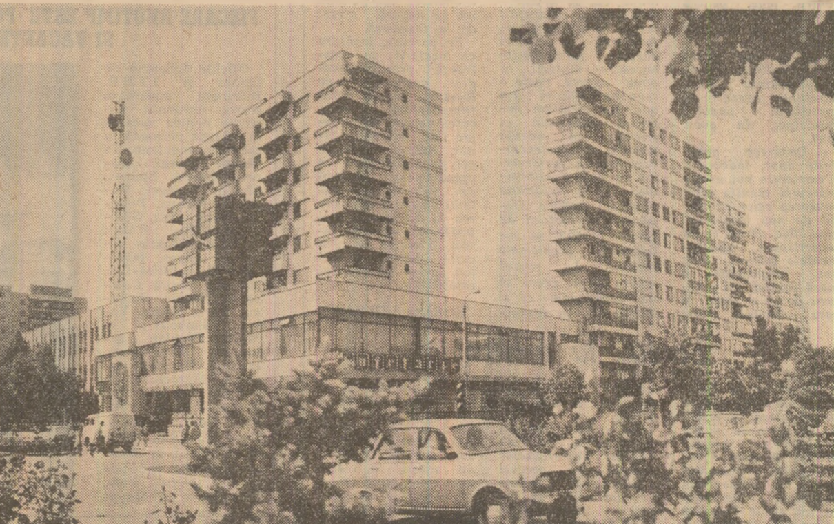
Imagine din centrul orașului Slobozia.