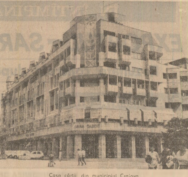
Casa cărții din municipiul Craiova