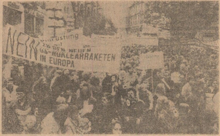
Demonstrație în orașul vest-german Kaiserslautern pentru retragerea rachetelor nucleare cu rază medie de acțiune

BONN 4 (Agerpres). — Referindu-se la ședința extraordinară a Bundestagului consacrată examinării problemei rachetelor nucleare „Pershing 1A”, vicepreședintele Partidului Comunist German, Ellen Weber, a apreciat că s-a înlăsat o șansă de a promova o atitudine constructivă față de negocierile sovieto-americanice de la Geneva, care intră într-o fază decisivă. Ea a deplins faptul că Bundestagul nu a adoptat imediat o rezoluție privind renunțarea la modernizarea acestor rachete și eliminarea lor. Totodată, vicepreședintele P.C.G. a subliniat că este necesar ca opinia publică, mișcarea pentru pace să-și intensifice acțiunile anti-rachetice, cerind cu și mai mare vigoare pentru ca proiectele de rezoluție avansate de social-democrați și ecologiști să nu rămână blocate prea multă vreme în comisiile Bundestagului. După cum se știe, Bundestagul vest-german a hotărât ca proiectele de rezoluție prezentate de opoziție să fie transferate spre examinarea comisiilor de resort ale parlamentului R.F.G.