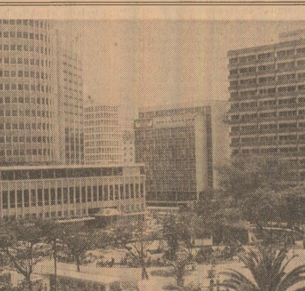
Imagine din centrul orașului Nairobi, capitala Republicii Kenya

HOTĂRÂRE. Guvernul Spaniei a hotărât să nu prelungească auto-